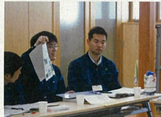
担当業務について作成した資料を用いて説明