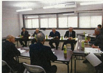
町の林業・木材産業関係者が意見交換