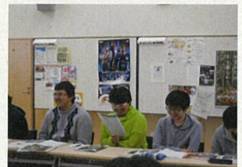
時折笑顔もこぼれる和やかな雰囲気でした

※「やまがた森林(モリ)ノミクス」： 山形県が平成25年11月に地域の豊かな森林資源を林業振興や雇用創出に活かしていくために行った宣言。