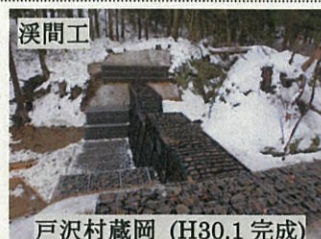
戸沢村蔵岡 (H30.1 完成)

最上支署では、そのような箇所において治山事業を行い、地域の安全・安心の確保に努めています。平成29年度に、支署管内で実施した治山事業の一部を紹介します。