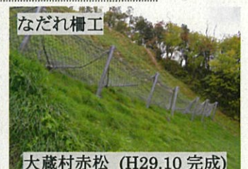
大蔵村赤松 (H29.10 完成)