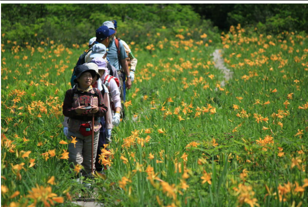
昨年の藤里駒ヶ岳登山(田苗代湿原にて)