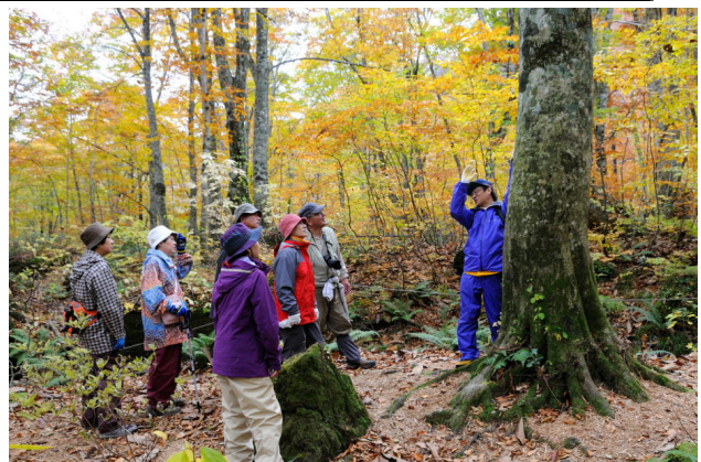
昨年の岳岱での紅葉狩り