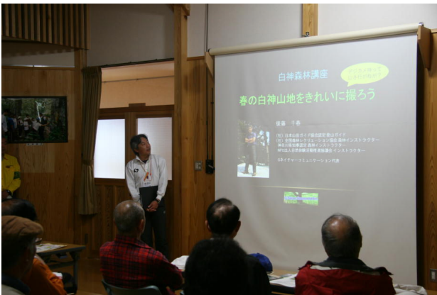
昨年の森林講座（撮影ワンポイント・アドバイス）