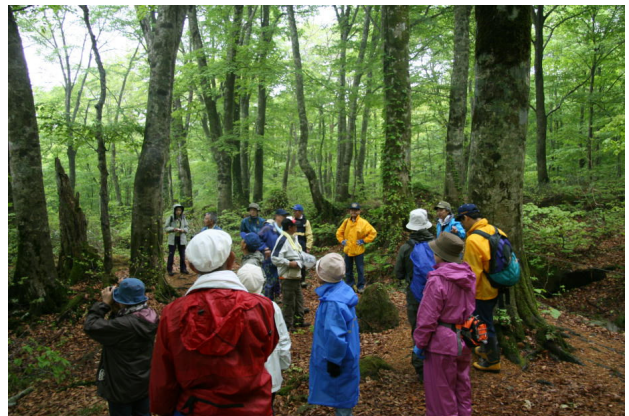
昨年の森林講座（ブナ林での撮影体験）