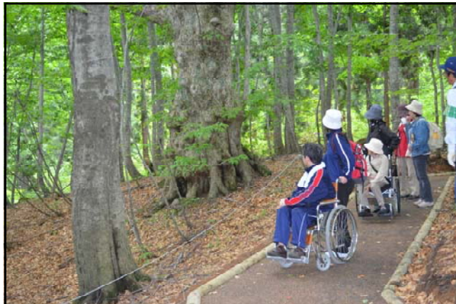
シナノキの巨木を眺める参加者

また、社会福祉協議会の方にお願ひし、職員が車いすに乗ったり、押ししたりして体験をしました。観察会終了後、参加者の皆さんからは、「リフレッシュができた。また誘って下さい」「（杖を使って）大変歩きやすい」等の感想をいただき、今後の業務の参考にしていきたいと考えております。