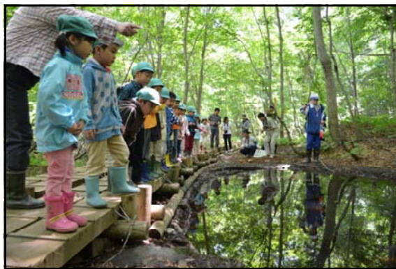
カエルいるかなぁ

お別れの際には「すごく楽しかった」「また来ていい？」などの声を聞くことができ、無事、森林教室を終えました。