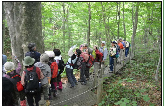
ブナの巨木にカメラを向けて(留山)