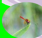
日本一小さい ハッチョウトンボ(オス)