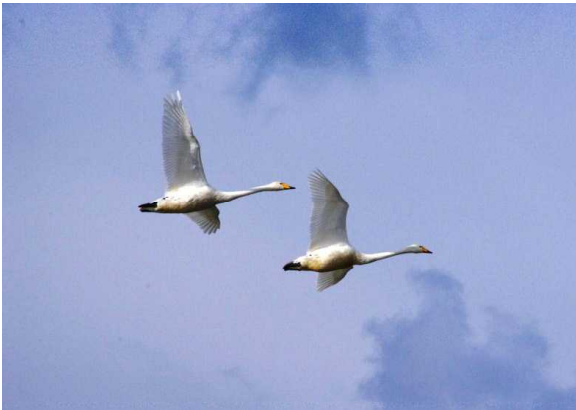
(オオハクチョウの飛行)