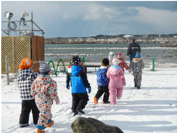
(観察場所へ向かいます)