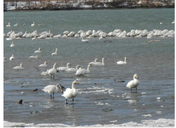
(近寄って来る白鳥の親子と逃げる白鳥)