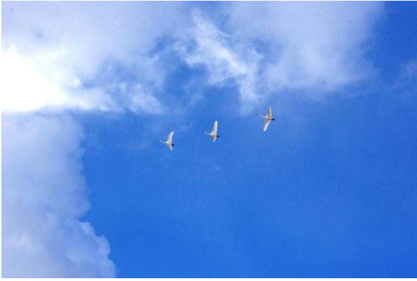
(白鳥の親子、冬の青空へ)