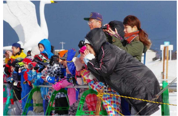
(飛び立つ白鳥に挨拶をしています)