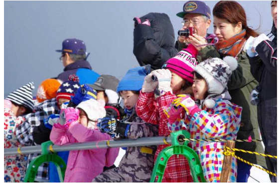
(真剣に白鳥を見ています)