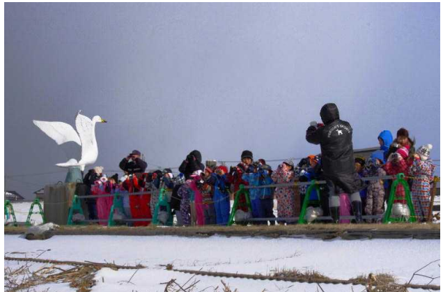
(横一列になって双眼鏡を使い観察会を開始)