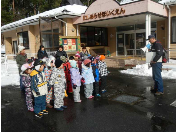
(出発式をしています)