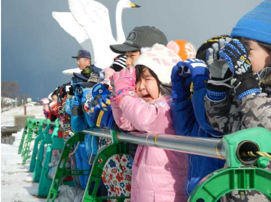
(白鳥をうまく見つけたかな)