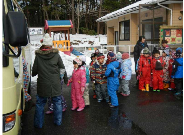
(保育園バスに乗ります)