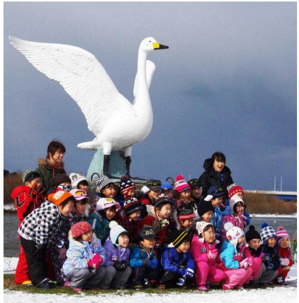
(スワンの像をバックに笑顔が素敵です)