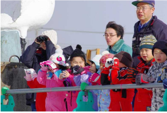
(双眼鏡を上手に使えているかな)