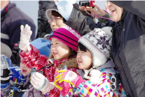
(飛び立つ白鳥に手を振っています)