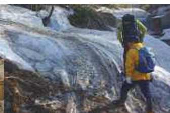
トラックベルト跡