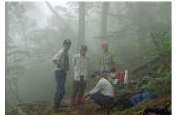
白滝～大朝日岳コース