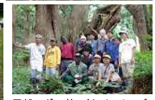
天然スギの前で「セイ、チーズ」