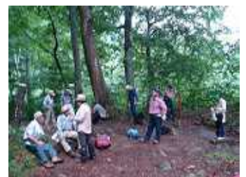
泡滝～大鳥池コース