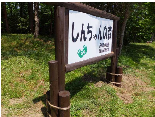
(すばらしいと思ったら、職人の方がいました)