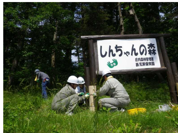
(チームワークが抜群です)