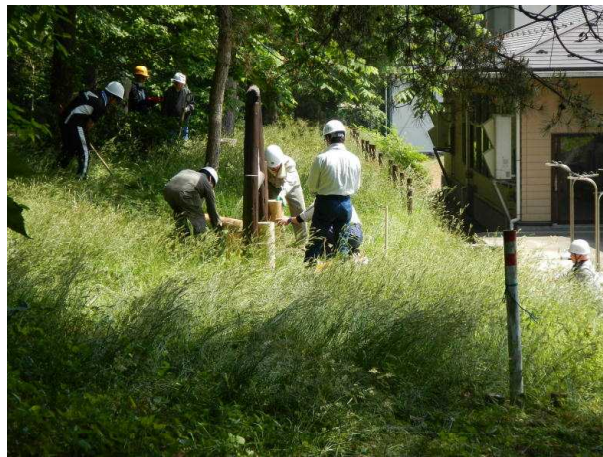
(看板が斜めになってます)