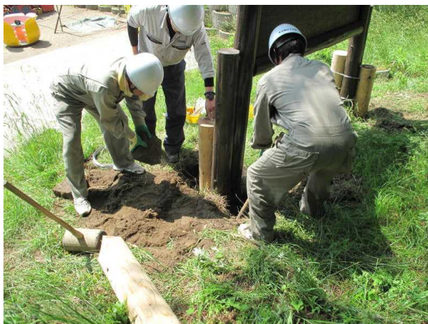
(高さを確認しながら慣れた手つきです)