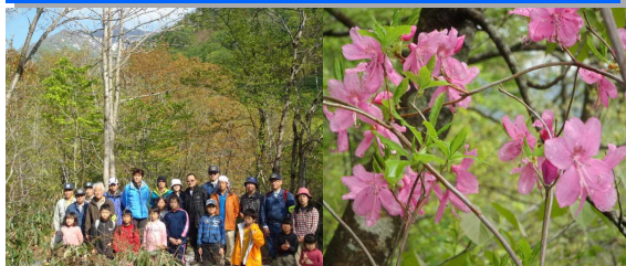
新緑のブナ林をバックに ムラサキヤシオ