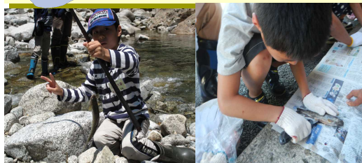
イワナをゲット イワナのさばき方