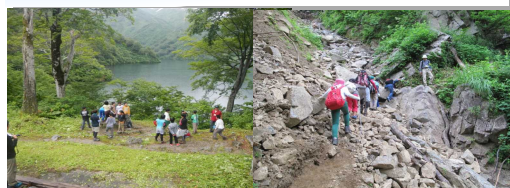
大鳥池 注意しながら歩こう