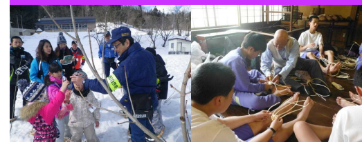
かんじきトレッキング ビニール草履づくり