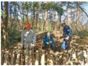
遊々の森での活動支援（きのこほだ木設置）