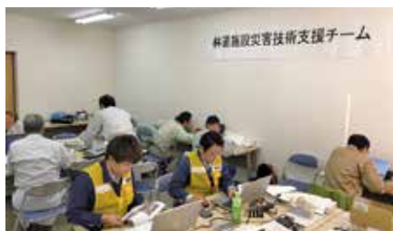
内業（図面、数量計算書作成）