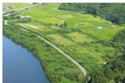
⑨ハヤブサ目線の湿地帯