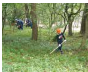
子供から大人までボランティア活動に汗を流しました。（光が丘ボランティア活動）

先人達によって植林された庄内砂丘のクロマツ林は、飛砂、強風から地域を守り、暮らしや産業の基盤となる歴史的遺産として捉えられ、小、中、高、大学生から社会人まで様々な世代がボランティア活動を通じて森林づくり活動に関わっています。地域を守り、地域に守られる海岸国有林を、「地域に愛される美しい森林」として後生へ引き継ぐため、これからは海岸林造成、松くい虫防除対策を推進するとともに、砂防林の大切さを次世代に伝えていけるよう活動支援に引き続き取り組んでいきます。