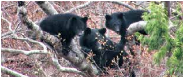
写真1. ツキノワグマの親子

青森県南部から宮城県と山形県北部を調査地として148頭のツキノワグマ（写真1）の遺伝子を調べ、それぞれの個体の間に存在する景観要素のうち、何が影響しているかを解析しました。