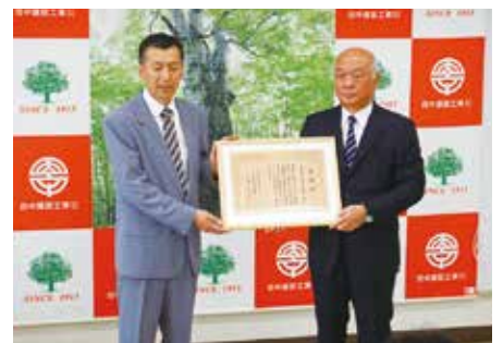
感謝状贈呈の様子