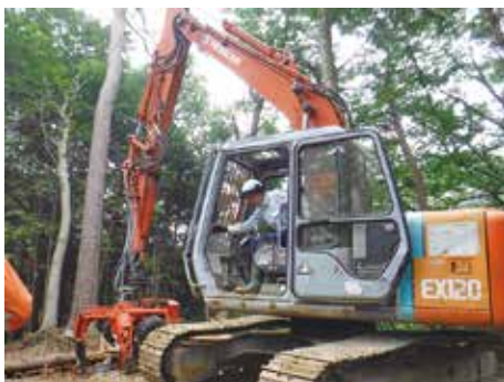
プロセッサの運転を終えて

四季ごとの様変わりです、見る者を魅了し、多くの方をこの山々へ誘います。さて、仕事の方ですが、多くの方が登山や山菜採取にこの地を訪れる事は、着任前から噂で聞いておりました。国有林のフィールドをPRするため、この地が国有林である事が、来訪された方の心に響く様に、オリジナルの立て看板を設置して、国有林のPRと環境美化活動を展開しております。 また、森林事務所のある西川町大井沢地区の方々には、国有林野事業のお知らせはもちろんのこと、各種制度のご案内を「こんにちわ国有林です」という回覧板を作成して、全戸に周知させて頂いております。