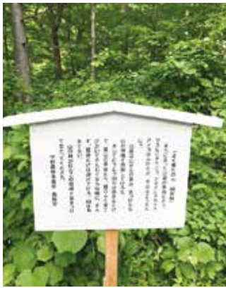
入林される方に国有林をPRする 歓迎看板

私の勤務している中村森林事務所は、山形県のほぼ真ん中に位置しています。その北には今から1300余年前に奈良時代の崇峻天皇の子、蜂子（はちこの）皇子が京都から海を渡って北上し、崖壁に舞う八人の乙女に心奪われ山形に上陸し、その後、三本の足を持つカラス（八咫鳥）に導かれ、「出羽三山」を開山しました。出羽三山は羽黒山、湯殿山、月山の三山で構成され、東北で唯一、皇族の墓が在ることでも有名です。 また南には、鎌倉時代に北条時頼により閉山弾圧を受けたと伝わる「霊峰大朝日岳」を中心とする大朝日連峰の稜線が連なっております。どちらも多くの歴史に彩られた人気の高い山々であり「にっぽん百名山」に数えられ、多くの登山者がこの地を訪れます。 中村森林事務所は、出羽三山と大朝日連峰の狭間に位置しており、標高も高く山形県で唯一の「特勤地（へき地）」箇所となっております。冬には一夜三尺の雪で全てを覆い隠し、春になれば冬を堪え忍んだ新緑の息吹、秋には真っ赤に彩り冬支度を整える。そんな