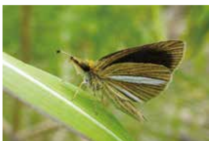
⑤ギンイチモンジセセリ