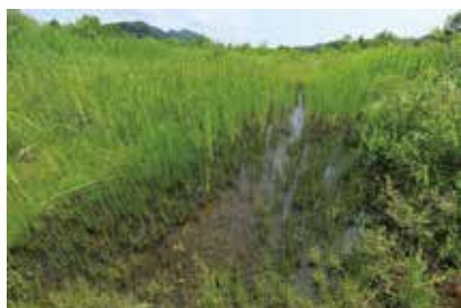
①自然再生された湿地

盛夏には、夏の季語『行々子』の通りオオヨシキリが“ギョギョシ！ギョギョシ！”と賑やかにさえずります⑦。餌の昆虫類が豊富なこの場所は、小鳥達にとっても居心地が良いのでしょうか。この湿地の背後には岩壁がそびえ立ち、そこから小鳥を狙うハヤブサ⑧が……。この岩壁上部から見下ろす湿地帯は、水田と川沿いの道路に挟まれたわずかな空間なのですが⑨、春～夏の短期間でも生態系ピラミッドの底辺から頂点まで観察できました。コロナ禍でなかなか行楽地に行きづらい今こそ、腰を据えて身近な自然を観察してみませんか？