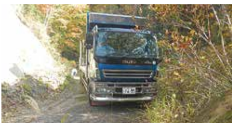
R=12 掘割では両側の草木や崩土が支障となる