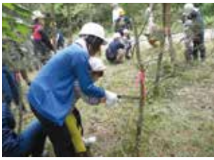
西荒瀬保育園 海岸国有林での親子枝打ち体験

平成22年に「遊々の森」として西荒瀬保育園（酒田市）と協定締結した「しんちゃん森」は、保育園庭に隣接し、園児達の自然環境教育の場、森林の遊