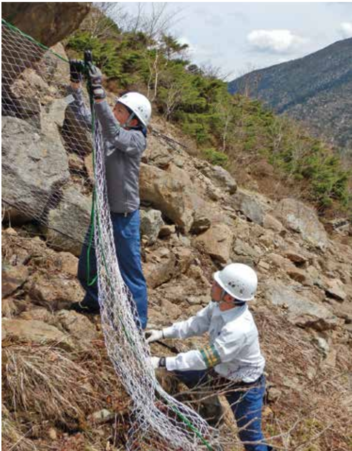
支署職員によるネット張り

今年は、昨年より1か月早く、雪融けと同時にネットを張ることができたので、シカの食害に対する高い防止効果が期待されます。