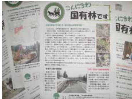
大井沢地区の全戸に配布しているPR誌

現在、当方の管内では3社の事業者が製品生産請負契約により、国有林の立木伐採を実施しており、現場監督員業務に従事しています。伐採のやり方も昔の様にチェーンソーで伐採してトラックで運材する方式から、車両系木材伐出機械（ハーベスタ・プロセッサ