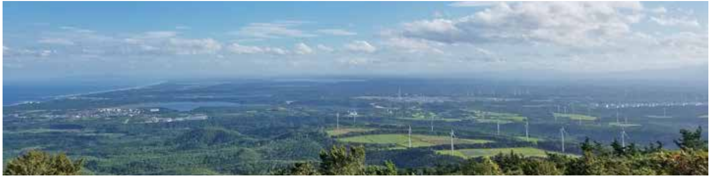
左手奥が太平洋、風力発電施設と石油備蓄基地