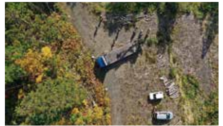
終点車廻しの計測状況（ドローンにて空撮）