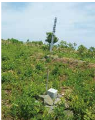
山頂の標柱と三角点