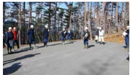
鉄鋼スラグ施工後の路面状況

その結果、路盤は散水とローラーによる転圧で固化するため、降雨による洗掘防止と車両通行による轍掘れの防止や路盤からの防草効果が期待できるメリットがある。一方で、散水用の水の確保や、急勾配箇所ではタイヤが滑る懸念があるといった留意点も学びました。今年度は、過去に鉄鋼スラグ