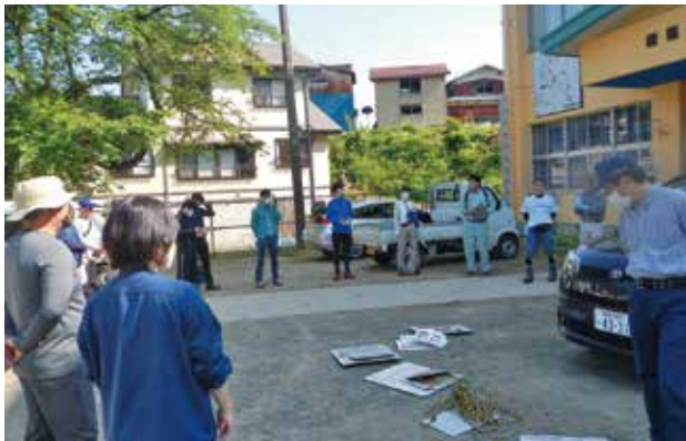
出発前の打合せ風景

5月24日、その摩耶山で登山道雪害調査が実施されました。雪害調査は、冬が終わり登山シーズンを迎えるにあたって、登山道に危険箇所が