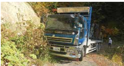
R=12 外側では草木や崩土が支障となる

この検証結果を踏まえ、今年度は運材トラックが安全に走行できる設計・施工について試験施工も行って確認することとしております。