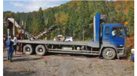
路側ぎりぎりまで使って旋回する10t積トラック