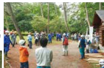
今年も多くの参加者が集まった光が丘ボランティア活動