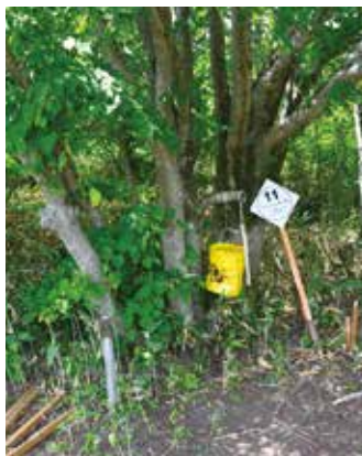
クマよけの一斗缶とルート案内板

三八上北森林管理署 〒034-0082 青森県十和田市西三番町1-27 TEL 0176-23-3551 FAX 0176-24-2020