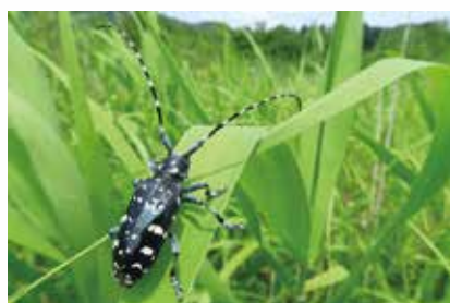
⑥ゴマダラカミキリ