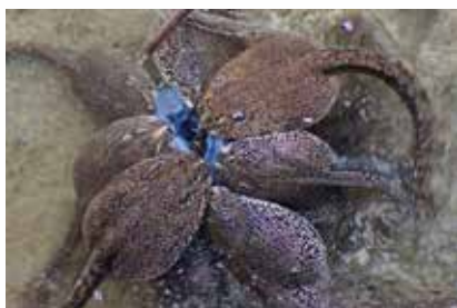
②ヤマアカガエルのオタマジャクシ