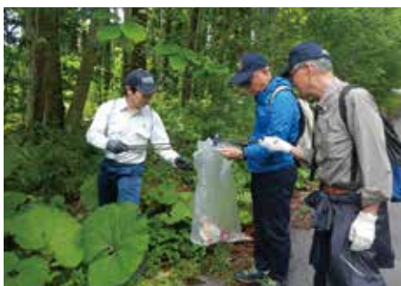
国道102号沿線の道路清掃奉仕活動

森林づくりの大切さを従業員や家族等に伝え広め、植樹・育樹活動を地域の先頭に立ち実施していくことによる、地域・社会への森林づくりへの活動普及効果はとても大きく、森林・林業の発展に多大なる貢献をされています。