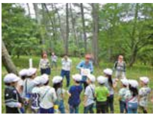
クロマツ林散策（松くい虫被害について説明を受ける園児たち）

び場として活用されるとともに、植栽、下刈、枝打ち等の森林整備活動が親子行事として開催されています。