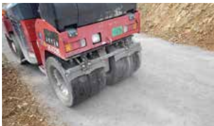
鉄鋼スラグ施工状況（ローラー転圧）

安定した路体を確保するための手段の一つとして期待されている、鉄鋼スラグを使用した路盤工（簡易舗装）について、昨年度は実際の施工現場を確認しました。