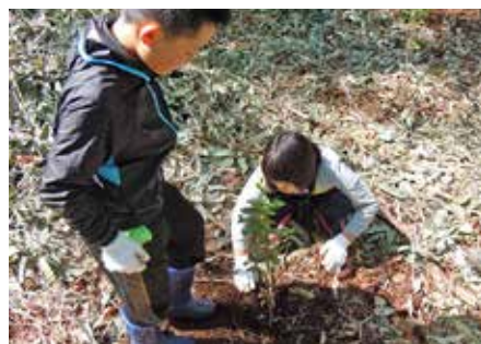
ブナの苗木植樹の様子