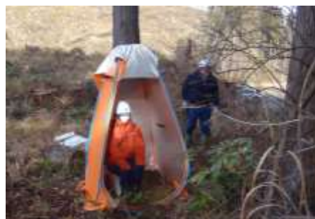
写真1 実証実験風景

アンケートでは、座り心地・持ち運びとも段ボールタイプが1番好評でしたが、湿り気のある林内では、耐久性・安定感に欠けることが分かりました。一方で、折りたたみタイプは、プラスチック製のため座り心地が固く、重いという意見がありましたが、耐久性・安定感があり、今回用意した3タイプの中では1番林内での使用に優れていると考えます。