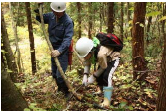
育樹祭除伐作業風景 (H23. 10. 24)