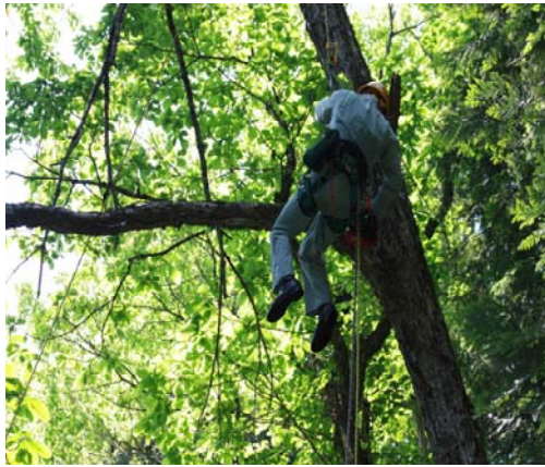
ボランティアによる枯枝落とし (H23. 5. 11)