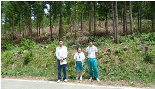
西平内中学校職場体験 (H23. 7. 7)