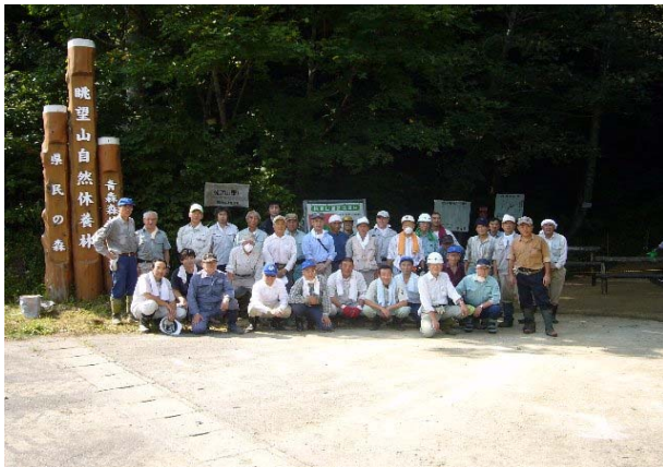
遊歩道整備記念写真 (H23. 9. 16)