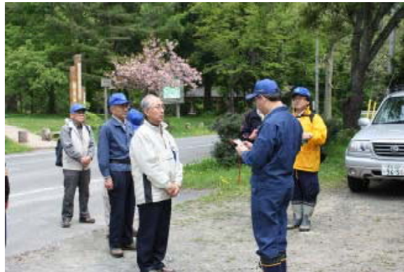
山火事防止森林パトロール証明書の交付式 (H22. 5. 27)