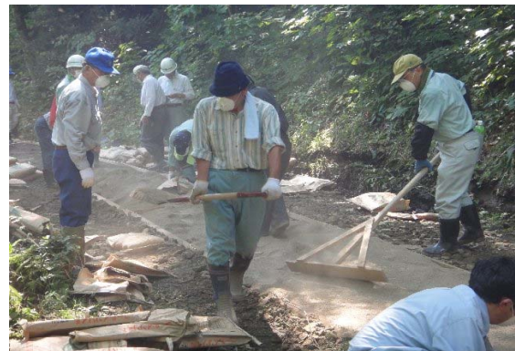
遊歩道整備作業風景 (H23. 9. 16)