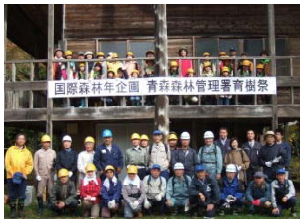
育樹祭記念写真 (H23. 10. 24)