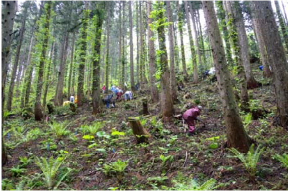
生協ふれあいの森植樹 (H23. 5. 22)