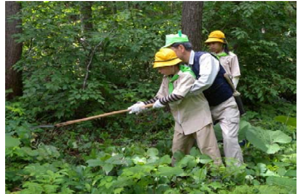
沖館地域緑の募金推進協会体験林業 (H23. 6. 26)