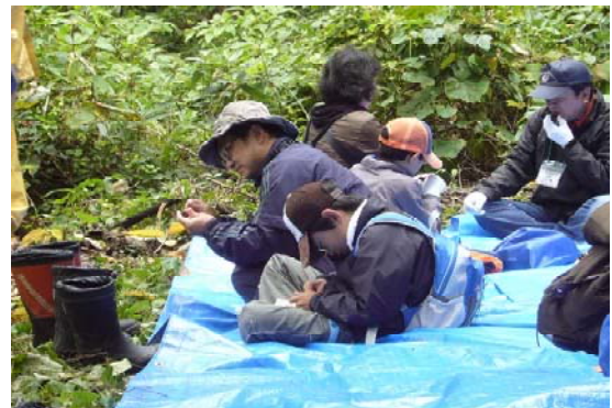
「ドコモ八甲田萱野高原の森」森林教室 トチ笛作り (H23. 10. 1)