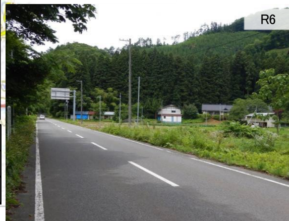
【④小川原地区 保全対象】