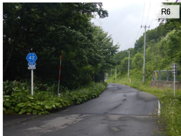
【③耕英地区 保全対象】