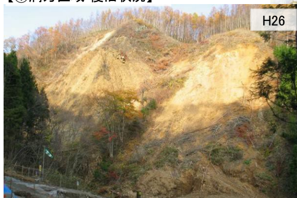
【①洞万区域 復旧状況】