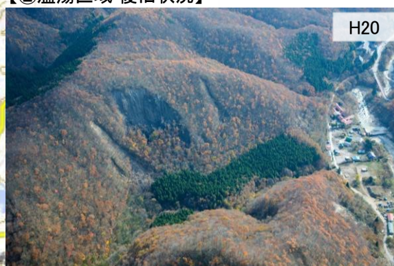
【②温湯区域 復旧状況】