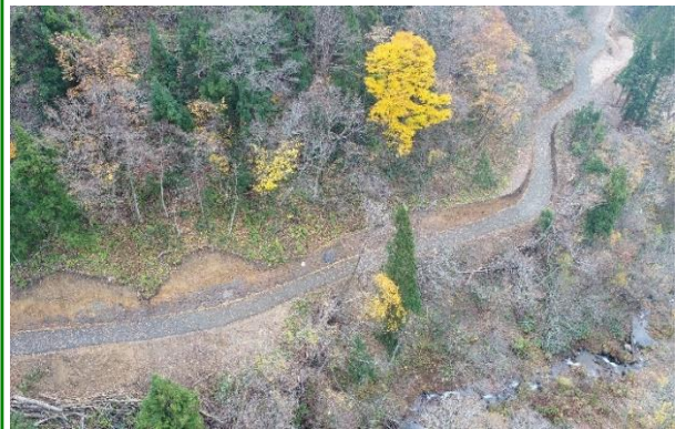
林道（林業専用道）開設