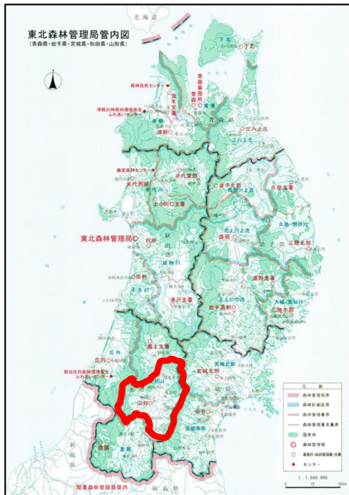
最上村山森林計画区位置図 (山形森林管理署)