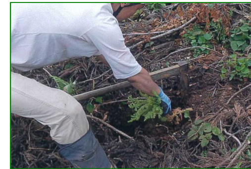
三ツ目内山国有林（植付）