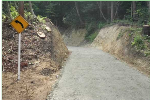
林道（林業専用道）新設