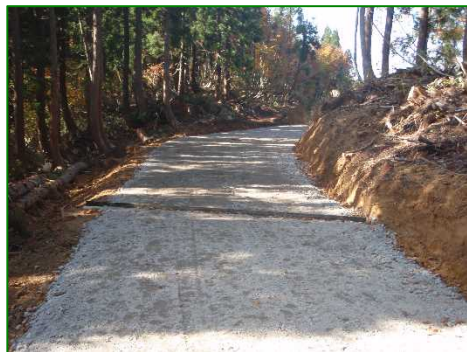
林道（林業専用道）新設