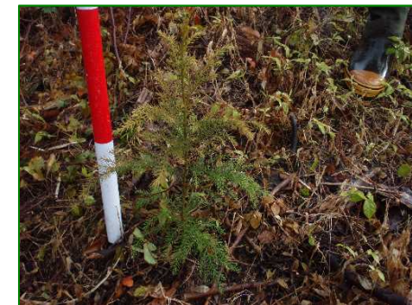
滝ノ沢入国有林（植付）