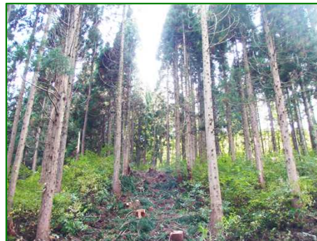
大沢外国有林（間伐）