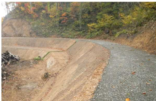
鷹巣沢林道（林業専用道）