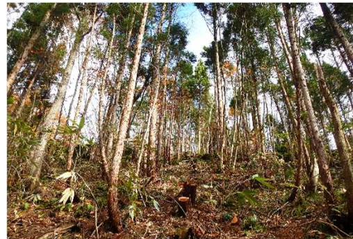
臼ヶ沢国有林（保育間伐）