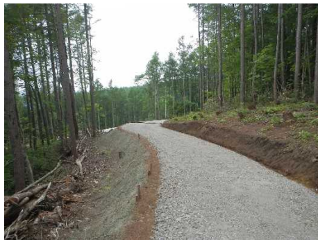
荒沢国有林（荒沢林道(林業専用道)）