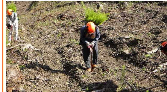
外山第1国有林（植付）