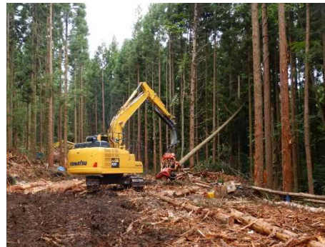
一方井国有林（保育間伐）