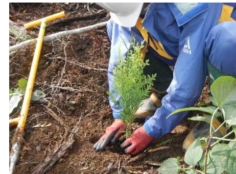
矢櫃山国有林（植付）