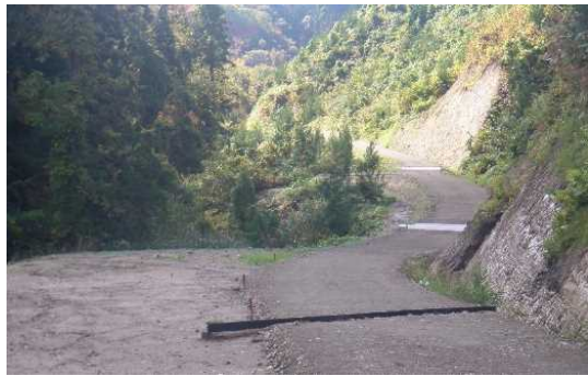
新城山国有林（戸ヶ沢林道（林業専用道））