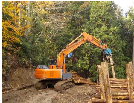
瀬戸子山国有林（保育間伐）