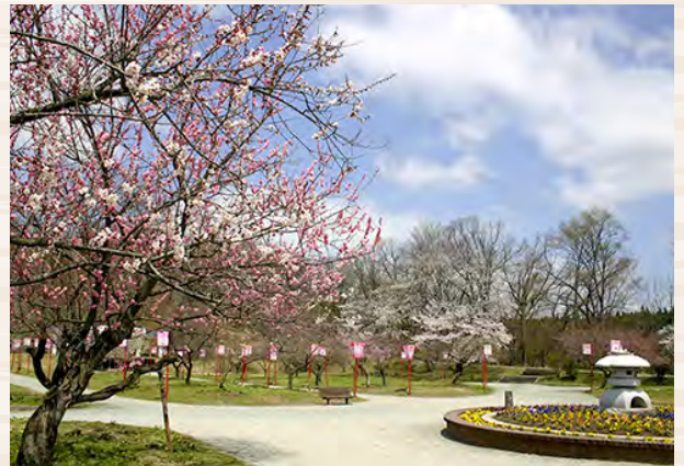
真室川公園「梅の花」

文化面では、全国的に有名な民謡「真室川音頭」の発祥の地として知られ、「真室川音頭パレード」や「真室川音頭全国大会」が催され歌い継がれています。真室川音頭の歌詞内にある「梅の花」は町の花とされ、真室川町木ノ下地内にある真室川公園では梅の木30種類が植樹され、春には、「桜」「桃」の花とともに一斉に開花します。開花した花は、「真室川梅まつり」内でライトアップされ沢山の観光客が会場に訪れます。