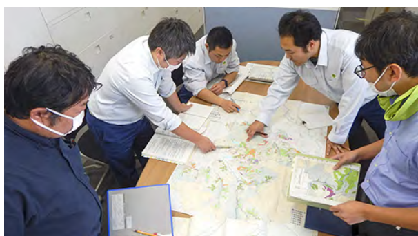
施業箇所等の打合せ