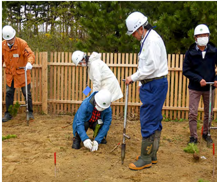
現地見学会の様子 (海外防災林でのクロマツ苗植栽)

モニターの方には、毎月の広報誌等の送付や、造林事業、治山事業箇所等での現地見学会を通して、国有林野事業への理解を深めていただき、アンケートへの回答やモニター会議により、国有林野事業についての御意見・御要望をお伺いしています。