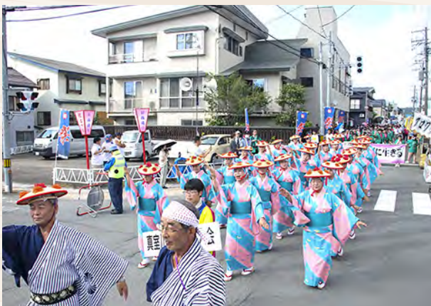
真室川まつり「真室川音頭パレード」

雪は、農産物の生産において豊かな恵みをもたらし、町の主要作物である米は、食味鑑定コンクール全国大会で優秀な成績を収めるなど全国から評価を得ております。また、ニラ、ネギ、里芋などの園芸作物や冬期間にハウス内で栽培する促成山菜(夕