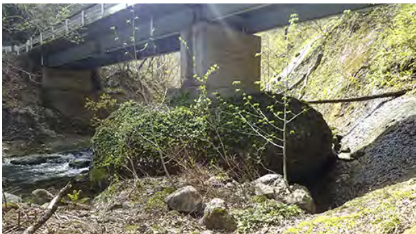
危険な状態の橋台

当署では、宮城県と協力して、山形県まで通り抜けることが出来る「二口林道」を管理しております。この路線にはいくつか橋がありますが、そのうち「磐司橋」という橋を平成25年に点検したところ、橋台の1つが危険な状態になっており、今後の通行を考えると架け替えを行う必要があることが判明しました。