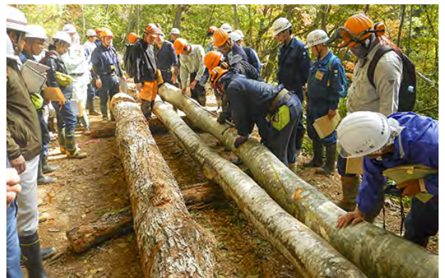
採材検討会の様子

そこで当署では、木材市場関係者を講師に招き、国有林から抜き切りされたブナ、ナラなどを使って、曲がりや節等の欠点が樹種によって価格にどのような影響があるのか、どの位置、長さで切れば高値が付くのかなどを学ぶ採材検討会を10月19日に開催しました。