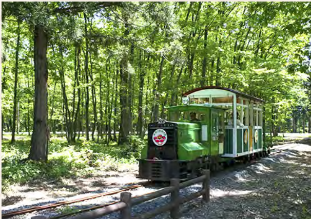
林業を支えた「森林トロッコ列車」

真室川町は、山形県の北部に位置し、町の西部から北部にかけて出羽山地の山々が、北東に奥羽山脈の神室連峰が連なっており、町域の大部分が森林で占められております。そのような自然環境から古くより林業の町として栄えてきました。