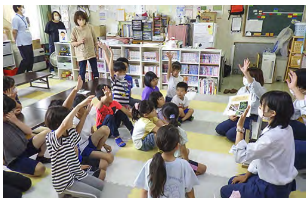
クイズに元気に答えている子供たち

座学では森林の役割や、林業の概要・重要性について説明し、子供たちの関心を引きやすいようにクイズを盛り込んだり、測幹や輪尺等の木を計測する道具や、クマ鈴やクマスプレー等のクマよけ対策の道具を実際に見て触ってもらったりしました。体験会ではスギや広葉樹の丸太をノコギリで切り、切った輪切りに自由にイラストを描いたり、用意した木の葉や押し花でオリジナルの葉を作成したりしました。