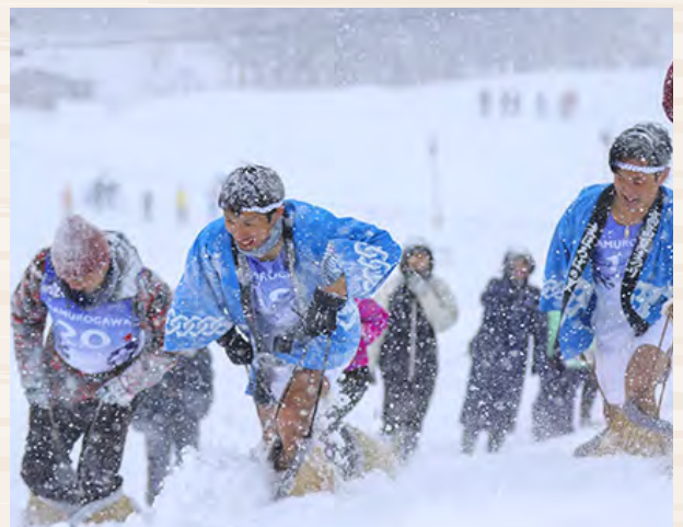
ホワイトアスロンの様子

その他の四季折々のイベントも充実しており、夏の「真室川まつり・花火大会」、秋の「真室川町大収穫祭」、冬の雪を楽しむ創作競技大会である「ホワイトアスロン」など1年間を通じて様々なイベントをお楽しみいただけます。