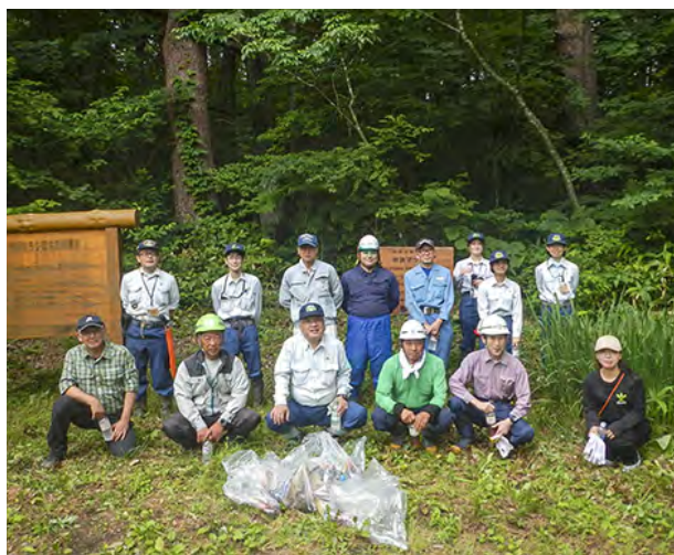
毎年の取組の成果でゴミも減少

ゴミ拾いは毎年ゴミ袋3つほど出ていましたが、今年度は2つになり活動の成果が現れてきたものと感じています。また、散策コースもとても歩きやすくなりました。