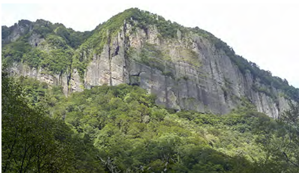
幅約3km、谷底から高さ約150mの巨大な磐司岩

林道周辺には、自然の造形美に圧倒される磐司岩や二口渓谷の紅葉など名所が多くあります。