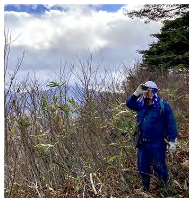
山中での巡検の様子

森林官の仕事のひとつに、地元へ寄り添い国有林の役割をPRすることが挙げられると思っております。山間部に位置する当地域は森林とともに発展してきた歴史があります。