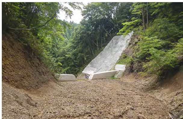
治山ダム上流側の溪流の状況

森林管理署では、これらの機能を高め、十分な効果が発揮されるよう、森林の造成や間伐などの森林整備を進めています。一方、山地災害などで荒廃した溪流や林地には治山対策を施し、森林へ復旧する手助けをしています。