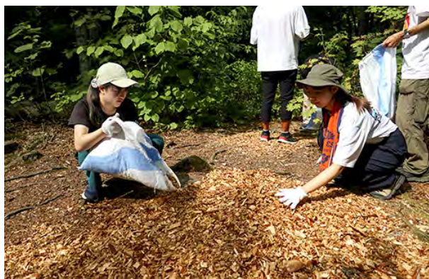
ウッドチップを遊歩道に敷き詰める学生たち

令和5年度は8月31日に2年生19名、9月11日に3年生16名の協力で、遊歩道上の地表に浮き出ているブナの木根を保護するために、ウッドチップを撒いて敷き詰めました。