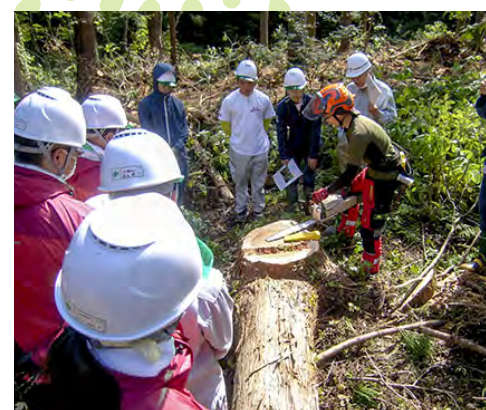
アカデミーの後輩へ伐倒を指導中 (木を伐っているのが筆者)

母校のいわて林業アカデミーの生徒を対象に、岩手県国有林材生産協同組合連合会がアカデミーのサポートチームの一員として実施した現地研修