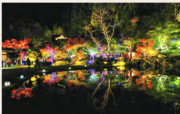
④藤原の郷紅葉ライトアップ

◎「歴史公園えさし藤原の郷」は、江刺地区にあり、平安時代を基にしたテーマパークです。奥州藤原氏の歴史を感じながら東北の歴史文化を体験でき、大河ドラマのロケ地としても知られています。2023年は、開園30周年を迎え、多くの観光客が訪れ、四季折々の花等の見どころ満載の文化スポットとなっています。