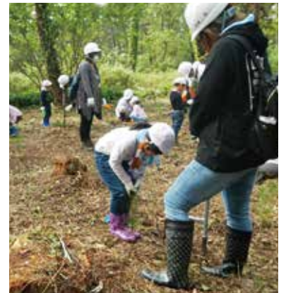
植え付け作業の様子 1