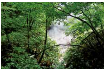
森の中の火山性ガス

あったということでした。それなりに森林官経験も長く、山を知った気でしたが、まだまだ知らないことがあるのだなあと気付かされた経験でした。特に安全面では、折に触れ注意喚起がありますが、私たちは、ものごとくに慣れてくると、とかく油断しがちです。このときは、特に被害も無く、事なきを得ましたが、油断の先には、落とし穴があることを忘れな