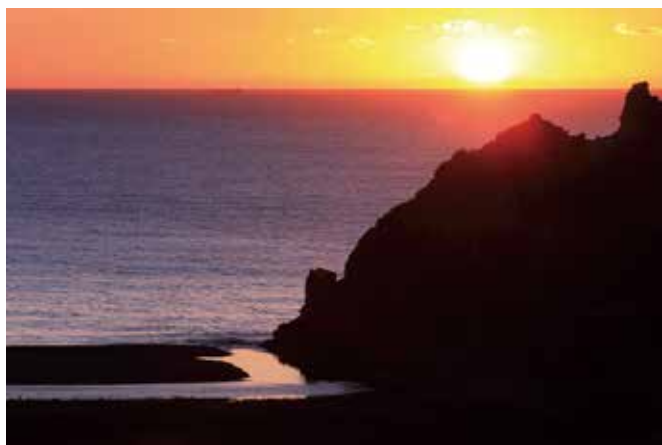
①追良瀬川河口の夕景

このようにサケは森林・河川・海洋生態系を繋ぐ大役を果たしていると思うと、スーパーで売られているサケの切り身に対する見方や焼き鮭の味わいも変わってきませんか？ 一生に一度の大仕事を終えて命果ててなお、生態系の中に取り込まれて役に立ち続ける、そんな生き方にも憧れの念を抱きます。