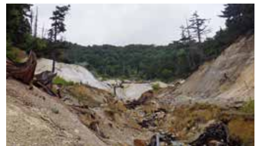
荒雄岳にある地獄

先に述べたように、この地域は多数の温泉がある温泉地なのですが、このような地域には、時折、火山性のガスが噴出し、その影響で草木が生えず、地表面がむき出しになっている地獄と呼ばれる場所があります。管内にも何カ所か、そのような場所がありますが、火山性の毒ガスを噴出しているようですが、それとは別に、突如、森林内に毒ガスが噴出している場所があります。より正確に言えば、森林内を流れる沢にあるのですが、赴任当初、私はこれに驚かされたことがあります。結論から申しますと、山火事と間違えて慌ててしまったのですが、そ