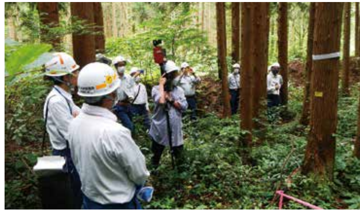
アウルでの標準地調査

今後、樹種や下層植生別の調査を実施し、事業レベルの使用に向けて取り組みを進めていきます。