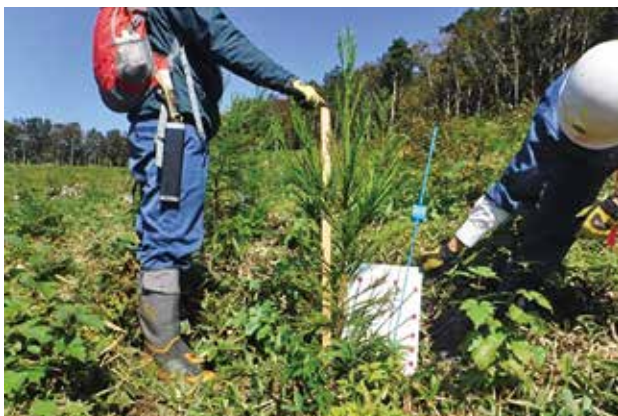
植栽3年目スギ特定母樹の挿し木コンテナ苗（宮城県仙台署管内）

森林総合研究所林木育種センターが認定し、宮城県が試験研究の中で育成した特定母樹の挿し木コンテナ苗を国