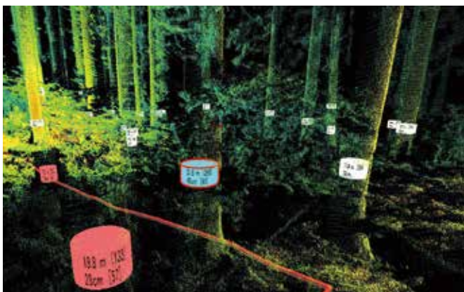
アウルはPC上で林木の形状や配置、地形などが確認できる

間伐等を実施する上で、今まで多くの人工を必要とした収穫調査について、森林3次元計測システム「アウル（地上レーザー）」を用いて、スギ人工林の標準地（20×20m）調査の検証を行いました。