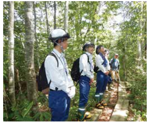
田苗代湿原での巡視活動

今年はコロナ関係や猛暑という大変な時期ではありましたが、ケガや体調を崩す学生も無く、無事に終了しました。