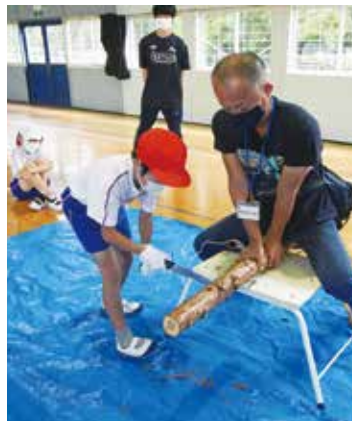
保育作業(丸太切り)

その後、教室において森林の機能・役割や人工林の手入れの必要性、自然環境などの説明をした後、子供達から、地元の木の数と