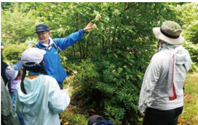
仁別森林博物館周辺での森林教室

毎年行われているもので、リピーターもいるほど人気のイベントです。本年度は新型コロナウイルス感染症の関係から開催が危ぶまれましたが、募集人数を例年の半数にするなどの対策を講じた上での開催となりました。