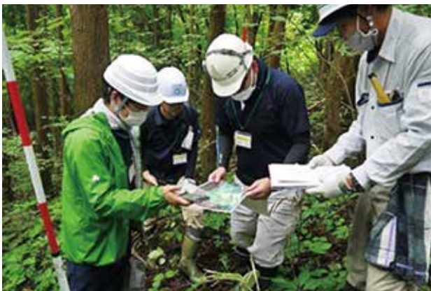
スマホを用いて現地踏査（路網）

今年度は昨年同様森林管理に欠かさない路網をテーマとして、ICTも活用し、現地の林況に応じた効率的な森林作業道の配置計画を策定できる者を