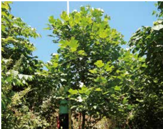
植栽3年目のユリノキ（秋田県米代東部署管内）

マハシロノキが1成長期で140cm以上、ユリノキで90cm以上と旺盛な成長を示し、下刈りがヤマハシロノキで1回、ユリノキが2回程度まで軽減できる可能性があります。今後更なる検証を進めていきます。