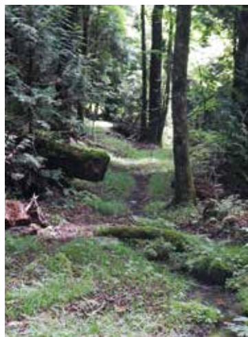
森林鉄道の軌道跡

国道106号早池峰山登山口入口から、早池峰林道を車で15分で早池峰山握沢登山口へ。