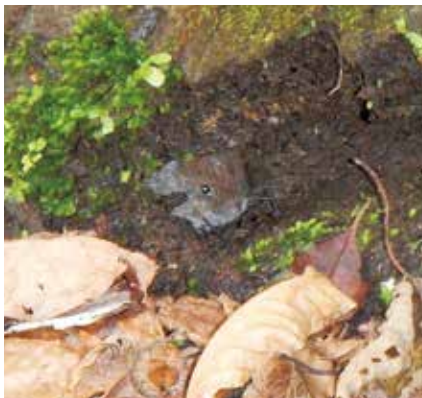
コースで出会ったヒメネズミ