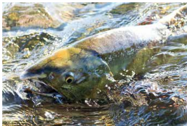
②笹内川を遡上するサケ