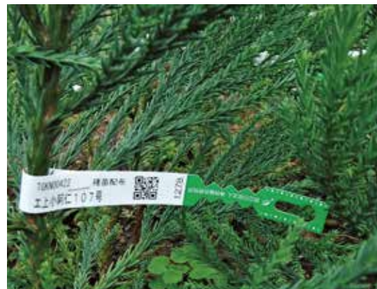
写真3. QRコード付き個体ラベルを付した苗木

この苗木に、個体コード（品種等の情報と連携した文字列）を割り当て、QRコードに変換しラベルに印字する取組に着手しました（写真3）。