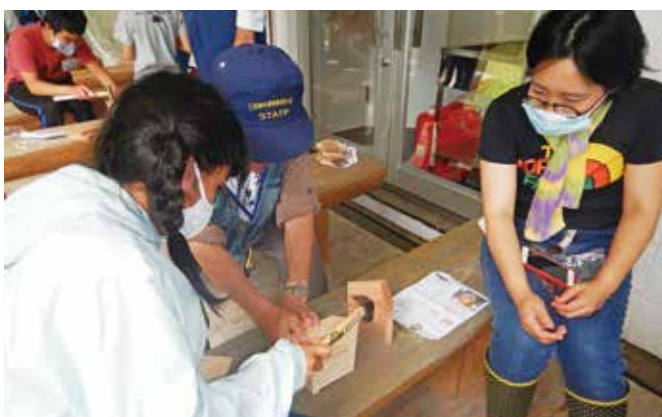
親子での木工品製作

参加者からは、今年は多くのイベントが中止となり、子供と出かけることも少なかったが、森林であれば密も避けられ、久しぶりに親子で森の自然や工作などをするのができたと好評でした。