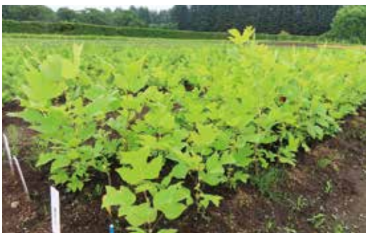
写真1. 苗畑で育苗中のユリノキ

原種園及び採種園を造成するため、通直性の高い優良個体を選抜するとともに、増殖技術開発のため樹齢や個体差に応じたさし木技術の確立に取り組んでいます（写真1）。