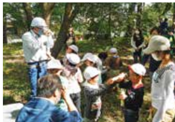
万華鏡あそびのご褒美

しみを込め、作詞作曲をされた「クロマツのうた」という歌のプレゼントがあり、先生、保護者、当署職員が見守る中、園児達は歌い慣れた様子で元気いっぱいの歌声を披露してくれました。