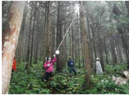
ドコモ網張の森での枝打ち作業

昨年の9月29日、当初は雨天のため網張ビジターセンター内でネイチャーゲームを実施してきましたのを見計らい、安全指導のち当署職員とともに歩道整備班と枝打ち班に分かれ作業をしました。