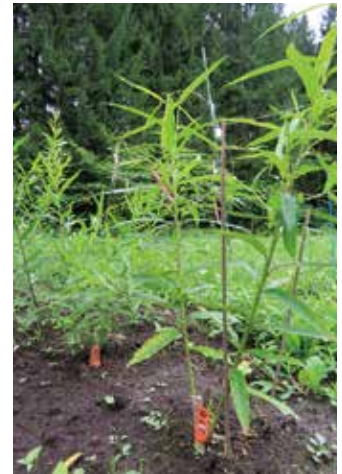
写真2. 直挿しによる発根調査

オノエヤナギは、木質バイオマス原料としての利用が見込まれ、萌芽更新による植栽コスト削減も期待されています。高い発根特性に着目し、休耕田等に直挿しすることを想定し、直挿しに適した挿し穂の形状やさし木時期の検討を進めています（写真2）。