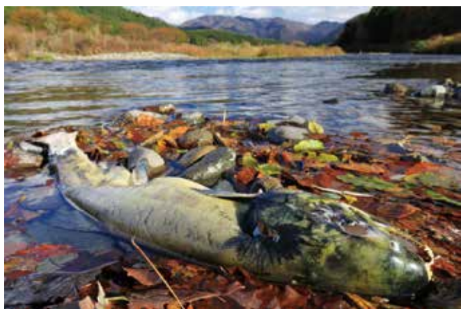
③産卵を終え力尽きたサケ。まずは目から食べられる。