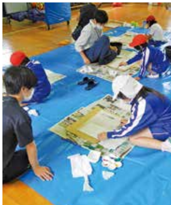
木の葉スタンプ工作

種類、水源の森はあるのか、鎮守の森とはなにか、森林と地球温暖化について、森林と海とのつながりなど、多くの質問がありました。 この森林教室を通して、森林の知識を深め、地域の森林を認識し、森林と海とのつながり、森林を大切にすることが地球の環境を守り生活をより豊かにすることを学んだものと思います。