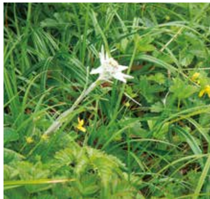
ハヤチネウスユキソウ