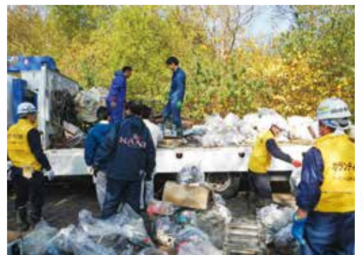
トラック3台分になりました。

矢巾町職員、(二社)青森林業土木協会のボランティアの皆さんで矢巾町内の国有林内林道においてクリーン活動を実施しました。