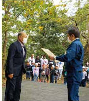
高橋署長から理事長へ感謝状を贈呈