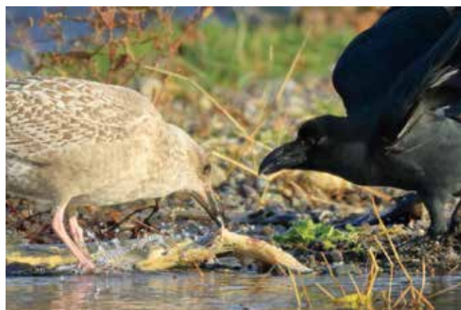
④サケの死体を食べるハシボソガラスとセグロカモメ