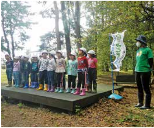
園児から歌のプレゼント