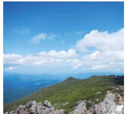
早池峰山からの眺望