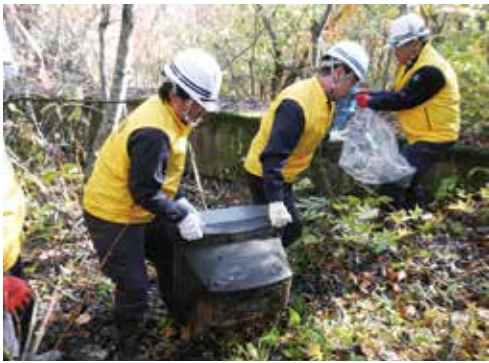
クリーン活動の様子