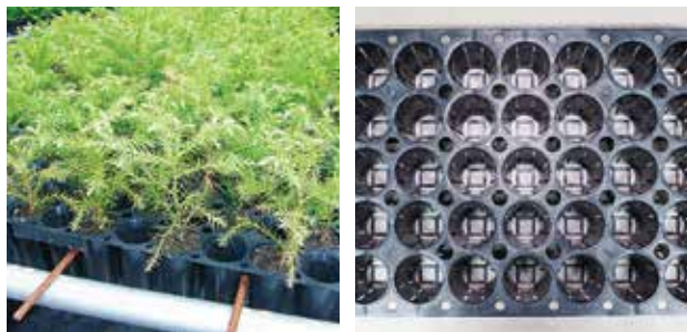
(左) 写真1 コンテナ苗

林業分野では、コンテナ苗とは、複数の育成孔がある栽培容器で育成された苗を指します(写真1)。一つ一つの育成孔が分割されていて、それらを一つのトレーにまとめて栽培できるようになっているものもあります。通常は、育成孔に入れる培地には、ヤシ殻粉砕物やピートモスなどの有機物を用い、重量を軽減します。