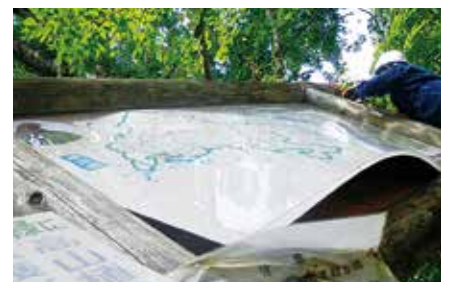
積雪により歪んだ看板

新しい看板の作成にあたっては、乗用車で運搬ができる大きさ、職員による設置や撤去が容易な構造、重さを考慮して行い、説明内容については、巡視員会議での意見を踏まえ、ペットを連れてくる登山者やストックによる掘り起こしへ対応するため、「ペットの持ち込みはやめましょう」、「ストックにはプロテクターを付けましょう」等の入林マナーを付け加えました。