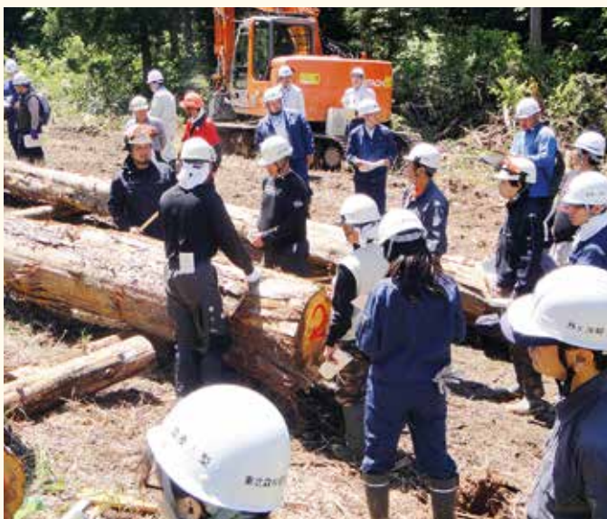
ヒバの採材について検討（青森署）

要になるため、検討会は、多くの請負事業者、多くの買受者・流通業者、多くの職員の参加を呼びかけて開催しています。 東北森林管理局では平成29年度に素材生産計画量と同数量の約70万㎡の素材販売を計画しています。こういった検討会を重ねながら、職員や請負事業者の能力向上を図り、信頼される国有林材の販売を行います。