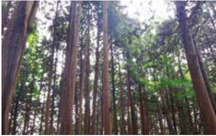
ヒバ林 (眺望山自然休養林内)

森林事務所から車で10分程のところ、青森県民の森にも指定されている眺望山自然休養林があります。 この眺望山周辺では日本三大美林のひとつであり、青森県の県木となっている天然青森ヒバを見ることが出来る