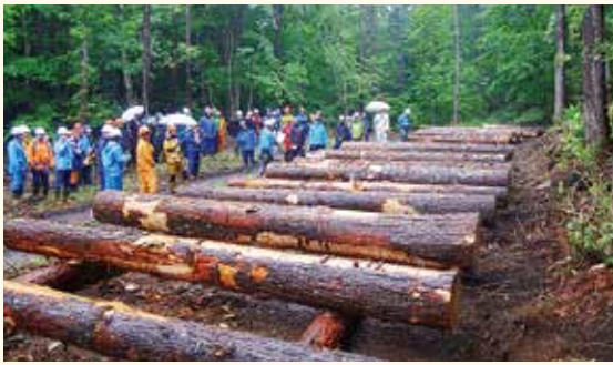
採材検討会の様子（三陸北部署）

東北森林管理局では、29年度に約70万㎡の素材生産を予定するとともに、計画的・安定的に木材販売することとしています。