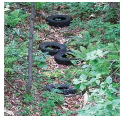
林内にタイヤが投棄

当日は、当署の職員6名、八幡平市市民課の職員2名の計8名により、3箇所において実施し、軽トラック4台分の不法投棄物を回収しました。また、市から提供いただいた「不法投棄禁止」の看板も設置したことです。今後、林野巡視等により不法投棄の発見に努めるとともに、八幡平市が実施する不法投棄監視合同パトロール等に協力するなど、八幡平市とも連携しながら、不法投棄の防止に努めていく考えです。