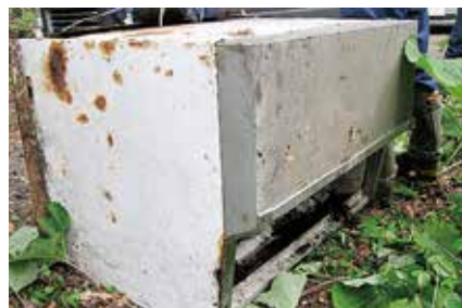
回収した業務用冷凍庫

の清掃センターでの処理を引き受けていただくこととなり、今回の実施となったものです。