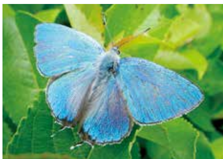
④オオミドリシジミ♂