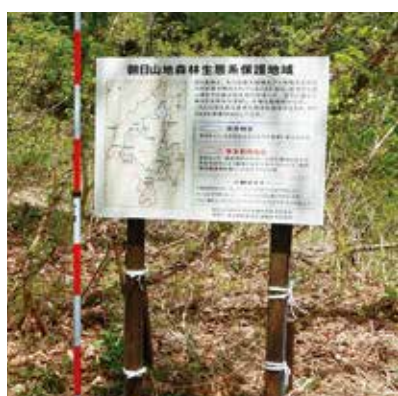
新たに設置した看板