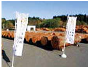
秋田県大館市での販売の様子

を実施しています。 検討会では、皆の意見が一致する木もあれば、全く違ってしまつ木もあります。一本の木をそれぞれの意見により採材した場合ごとの丸太の合計金額をシミュレーションしながら理解を深めることに心がけて行っています。 加えて、生産者、売る側、買う側が同じ目線、同じ感覚で材を評価できることが重