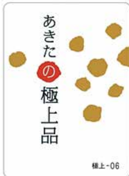
高齢級秋田スギに使用するロゴマーク

秋田県が取り組んでいる秋田発ジャパブランド育成支援事業の中に、高齢級秋田スギを「あきたの極上品」と位置づけ、国有林から生産される丸太で先行的に販売します。