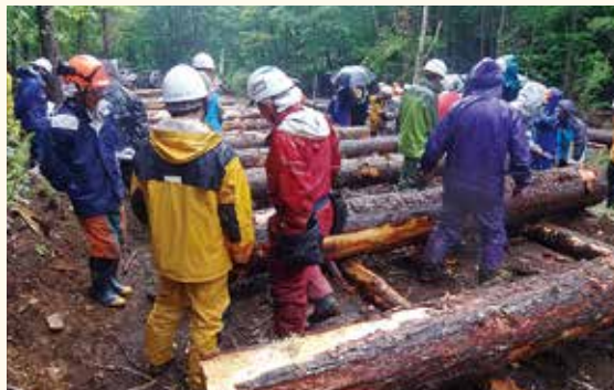
カラマツの採材を検討（三陸北部署）

品質区分も一般製材用材、合板・集成材に加工する材、低質材（製紙用チップやバイオマス燃料などに大きく区分されます）。