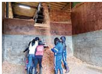
チップ工場を見学