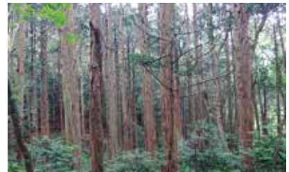
ヒノキ人工林 (眺望山自然休養林内)

なく、遊歩道も整備されていることから、初心者でも気軽に散策が楽しめる、青森市民はもちろん近隣市町村民の憩いの場として利用されています。