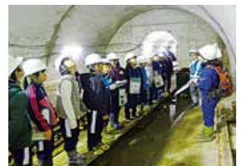
排水トンネル等を見学

今回、ご紹介した事例は一部ではありますが、最上支署では、引き続き、森林・林業の重要性や、地域の安全・安心に向けた取組などをよりご理解いただけるような取組を行っていきたいと考えています。