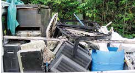
回収した冷蔵庫、ブラウン管テレビなど

不法投棄物は、林野巡視において発見したのですが、中には、(一)ゴミを指定のゴミ袋に入れながらも、収集指定場所に持ち込むのではなく、林内に投棄していたり、(二)「不法投棄禁止」という看板を設置している所にも投棄があったこと等が