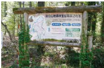
腐朽等が進んだ看板

保護林の設定に伴い生態系保護地域の目的や取組を説明した看板を登山道の入口等に設置して管理してきました。