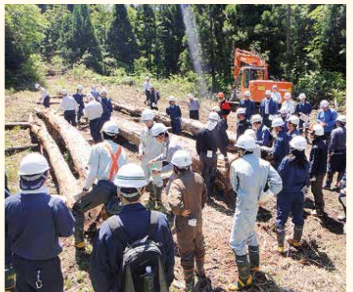
採材検討会の様子（青森署）