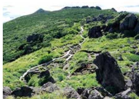
⑤早池峰山・御田植場