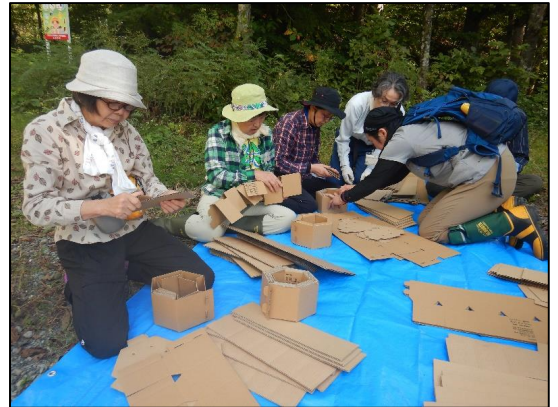
カミネッコン作成の様子

また、参加者の感想ですが、「この活動に興味があるのでぜひ継続してほしい。」「自然再生活動に賛同しているので、参加できて良かった。」「初めての体験だったので新鮮でした。今後も、活動の普及啓発に努めてほしいです。」など、たくさん感想をいただきました。今年度の自然再生活動は終了となりますが、来年度も計画実施していくこととなっております。来年度もぜひ参加をいただき世界自然遺産周辺地域での植え付け作業を体験していただければと思います。また、この活動を通して、たくさんの人とも交流していただければ幸いです。最後になりますが、第2回目についても参加された皆様のお力添えいただいたおかげで充実した作業ができ本当にありがとうございました。皆さんが1+1=3と頑張っている姿が、いまだに、目に焼き付いている今日この頃です。