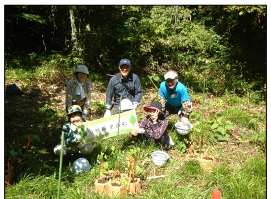
植えた稚樹の前で記念撮影