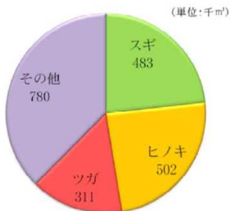
主要な樹種の賦存状況