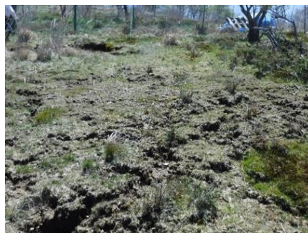
下層植生の衰退による土壌流出 (高知県・徳島県境)

問い合わせ先：四国森林管理局 森林整備部 技術普及課 企画官（自然再生担当） Tel 088-821-2121