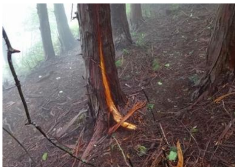
ニホンジカによる皮剥被害 (高知中部署管内)

・造林・生産事業では、獣害対策活動の実績として、公告日の属する年度及び当該年度より過去2年間、総合評価落札方式の加点基準により評価加点項目（2点）となります。