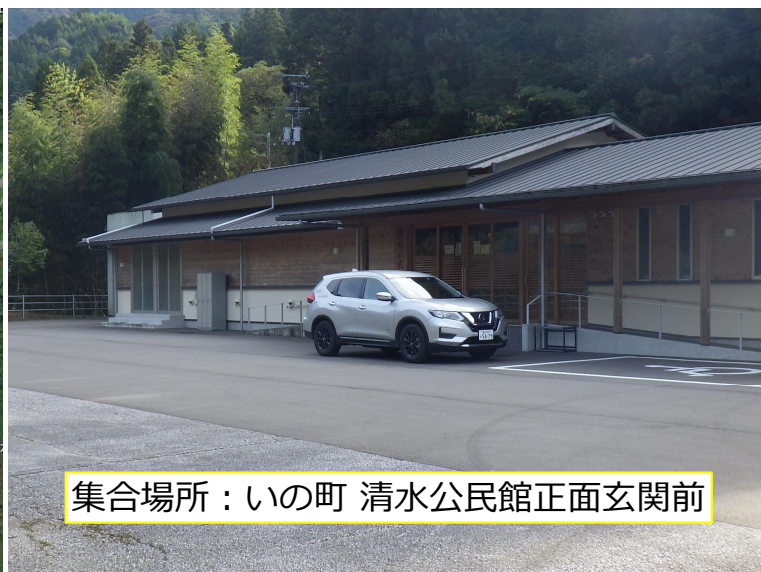
集合場所：いの町 清水公民館正面玄関前