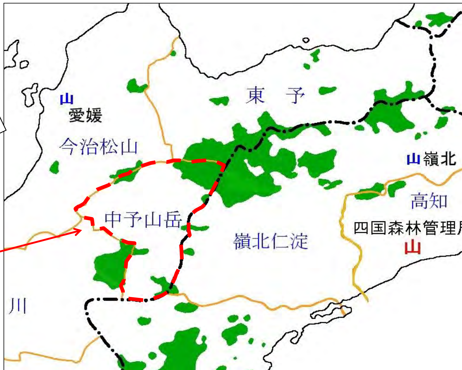
対策計画区拡大図