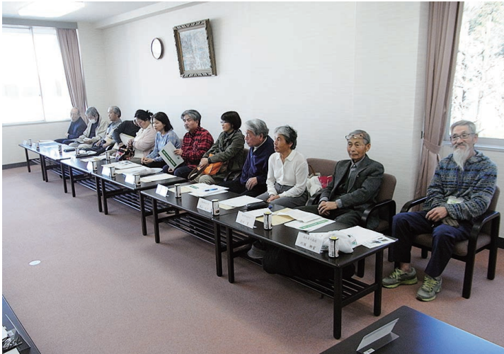
国有林モニター会議のモニター皆様

開かれた「国民の森林」に相応しい管理経営を行なうため、一般市民の皆様から幅広い意見や要望等を伺うものです。本年度は四国在住の二六名の方に御願