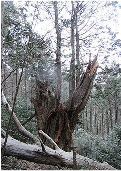
折合大ヒノキ (平成26年の台風の被害後と思われる)

か。樹脂を含んだその大きな根株からするとまだしばらくはその堂々とした存在感を見せてくれることと思われま