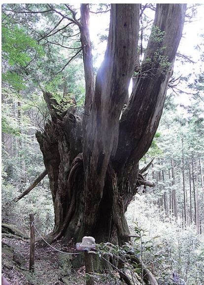
折合大ヒノキ (平成25年6月の様子)