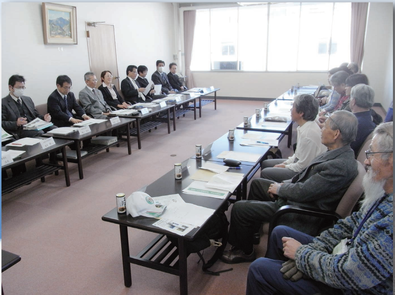
国有林モニター会議の様子

2月27日、12名の国有林モニターの方が出席され平成26年度国有林モニター会議を開催しました。 【詳細は2頁】