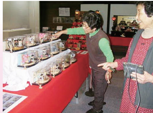
中岡慎太郎館にて展示