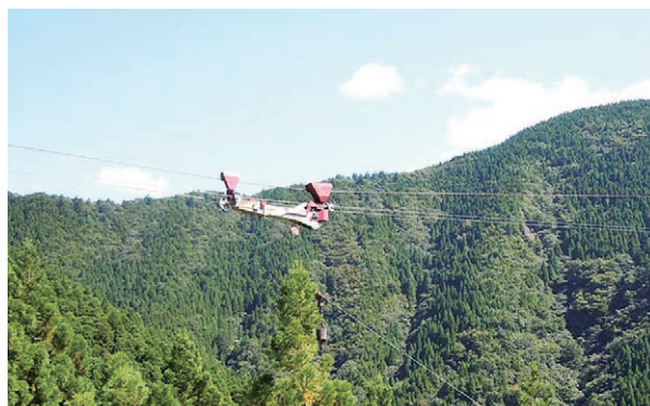
ジャストIIキャレット

は、急傾斜地で地すべり等があり、作業道作設が困難な状況の中で、架線集材(集材機・ジャストIIキャレット)と高性能林業機械(プロセッサ、グラップル)の組み合わせにより、生産性の向上を目指した間伐事業を実施しており、以下の取組や成果が評価され、授