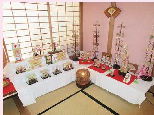
展示されたひな人形等