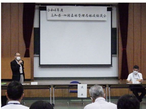
高知県林業振興・環境部副部長の挨拶の様子

副部長から、「森林環境譲与税の活用についても関心が高まっている中、市町村の林務担当者のマンパワー不足が課題となっており、これからますます市町村への応援が必要となっている。県としても各林業事務所に支援チームを作るなど、市町村へのさらなる支援強化に向けて力を入れていくので、四国森林管理局にも技術のノウハウを活かし、県と一緒に市町村の応援に引き続き力をお貸しいただきたい」等との挨拶がありました。