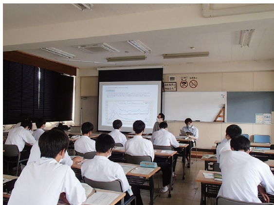
森林・林業に関する講義

四国森林管理局では、林業関係学 校への講師派遣や実習フィールドの 提供など、林業の担い手育成への支 援を行っています。6月10日には、 高知県立高知農業高等学校森林総合 科の2年生17名を対象に、入庁案内 及びICT技術を活用した森林調査 の方法等について講義と操作実習を 行いました。