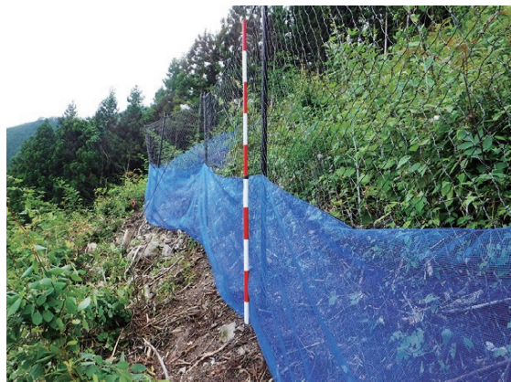
シカとノウサギ兼用の防護柵の試験

○課題一 令和2年度から令和5年度までの 開発期間に「ノウサギ食害防護柵の 防護効果検証試験」として、新植地