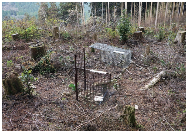
ノウサギ用箱わなの試験

の外からのノウサギの侵入を防ぐシ 力防護柵と兼用の防護ネットの開発 や安価な市販ネットの防護効果の検 証に関して取り組んでいます。