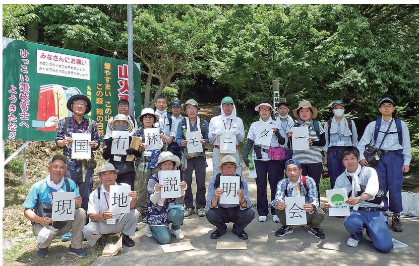
集合写真（飯野山登山口）

今後もモニターの皆様から寄せられた意見を参考としつつ、国有林の適切な管理経営を行い、多くの国民の皆様にも、国有林野事業への理解を深めていただけるよう努めてまいります。