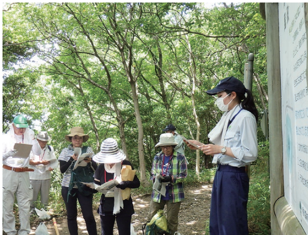
保安林の説明を行っている様子

また、道中では、国有林と民有林の境界の目印として設置している境界標や、指定されている保安林※の種類を示す保安林標識、図面の見方等について説明を行いました。