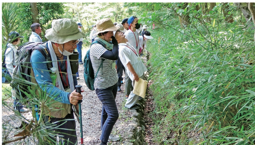
ネイチャーゲーム体験中の様子

その後、自然の中に目立たないように置かれた人工物を注意深く探し、生き物の擬態や、保護色、自然等について理解・関心を深めていただくことを目的に森林環境教育等で実施している、ネイチャーゲーム（カモフラージュ）を体験していただきました。