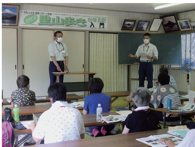
説明を行う島内業務管理官（右）と志賀所長（左）

参加者からは、「森林資源の循環利用の大切さがよく分かった」、「丁寧な説明で、森林・林業の現状や、四国森林管理局の取組をよく理解することができた」等の感想をいただきました。