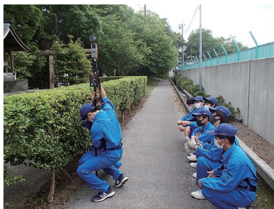
OWLでスキャンの様子

続いて、これからの林業に求めら れるイノベーションと題して、森林 管理局や森林管理署等で実証が行わ れている地上型レーザースカナ (OWL) を活用した森林調査と大型 ドローンによる苗木運搬などの事例 について紹介しました。