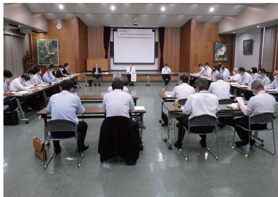
林政協議会の様子

なお、今後は、秋頃に、四国4県の林務担当者と林野庁、四国森林管理局による「令和4年度四国林政連絡協議会」を徳島県において開催する予定であり、各県の林政協議会で出された意見や要望も踏まえ、今後の森林・林業について、さらに深く意見交換と情報共有を図っていく考えです。