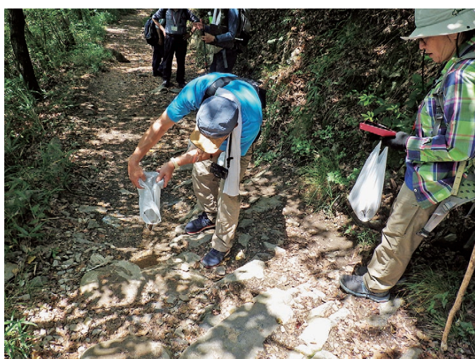
一日一石運動の様子

午後からは、登山口に用意した修繕用の石と土を登山者が持ち運んで登山道を整備する「一日一石運動」について説明を行った後、実際に登山道の修繕を行いました。