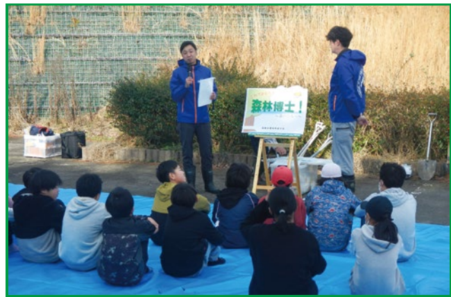
高知水源林育成士会の講義の様子

メインとなる植樹では、マツクイムシに抵抗性のある「スーパージンサつま」という品種のクロマツ苗木が用いられました。計500本の植樹作業でしたが、各団体の生徒ともに慣れた手つきで進めていき、予定1時間のところ、30分ほどで植樹が完了しました。当日は天気にも恵まれ、2月とは思えない暖かさの中でイベントを迎えることができたのは幸いでした。