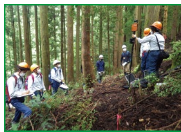
図4 市町村林業担当者研修（局）

②について、森林経営管理制度の導入によってますます市町村の役割が重要となつてきていることから、森林・林業技術に関する研修への市町村職員等の受入れ等、市町村への支援に取り組みます（図4）。 また、森林共同施業団地や公益的機能維持増進協定等の制度を活用して土場や森林作業道の共同利用を通じて、民有が連携した効率的な施業を推進します。 最後に、これらの取組については、令和6年度の四国森林管理局の重点取組や市町村支援ツールとともに四国森林管理局のホームページに掲載していきます。是非ともご覧いただき、民国連携の下で森林の有する多面的機能の発揮に向けた取組の推進について、ご理解とご協力をいただければ幸いです。