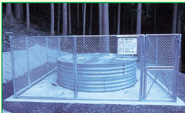
林野庁長官賞受賞工事（徳島署） 祖谷川地区麦生土（上）地すべり防止工事