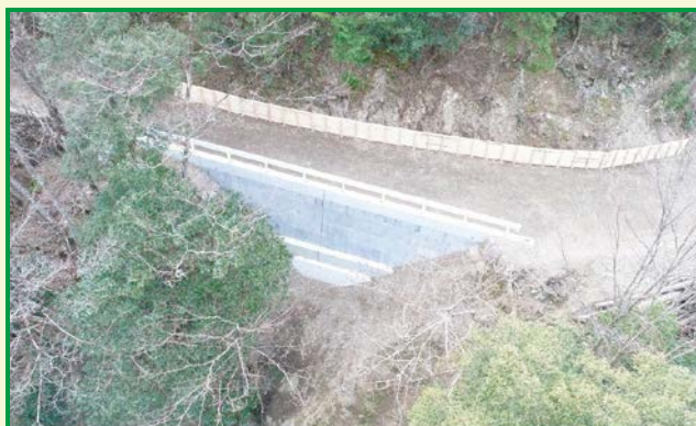
林野庁長官賞受賞工事（四万十署） 引地林道災害復旧外1工事

四国森林管理局では、健全な森林の維持増進のために、林道などの路網整備にも努めているところであり、引き続き安全な国土づくりに取り組んで参ります。