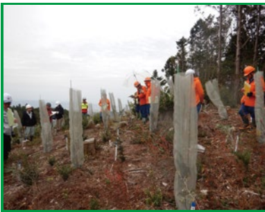
図3 低コスト造林現地検討会（嶺北署）

②について、森林経営管理制度の導入によってますます市町村の役割が重要となつてきていることから、森林・林業技術に関する研修への市町村職員等の受入れ等、市町村への支援に取り組みます（図4）。 また、森林共同施業団地や公益的機能維持増進協定等の制度を活用して土場や森林作業道の共同利用を通じて、民有が連携した効率的な施業を推進します。 最後に、これらの取組については、令和6年度の四国森林管理局の重点取組や市町村支援ツールとともに四国森林管理局のホームページに掲載していきます。是非ともご覧いただき、民国連携の下で森林の有する多面的機能の発揮に向けた取組の推進について、ご理解とご協力をいただければ幸いです。