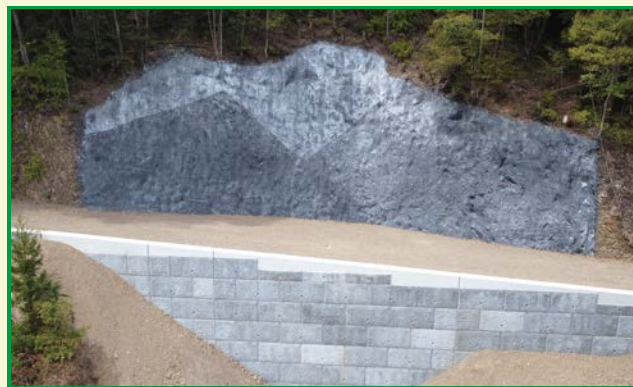
林野庁長官賞受賞工事（安芸署） 加勝林道災害復旧工事