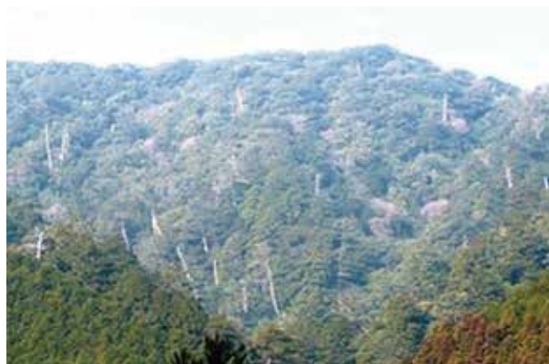
針広混交林（四万十署：四万十町）