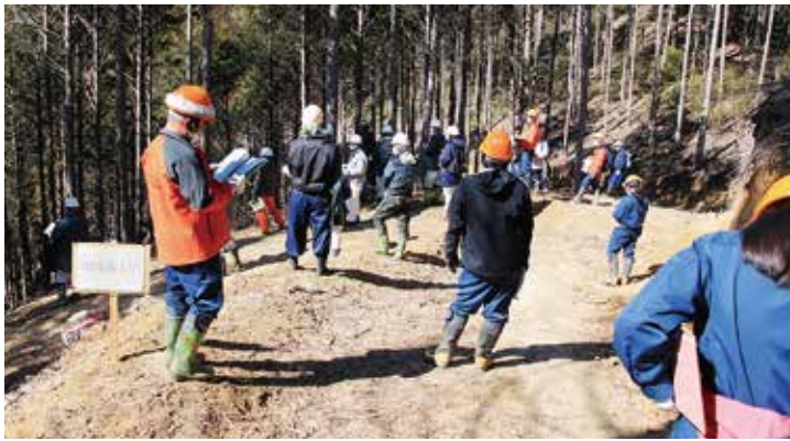
現地検討会の様子

このほか、高知県立林業大学校、とくしま林業アカデミーや南予林業アカデミーに対し、国有林のフィールドを研修の場として提供し、国有林職員を講師として派遣、作業実習への協力等により支援を行います。 さらに、香川県立農業大学の林業人材の育成コース（令和6年度に開講予定）に対しても、講師の派遣、フィールドの提供等の協力を予定しています。