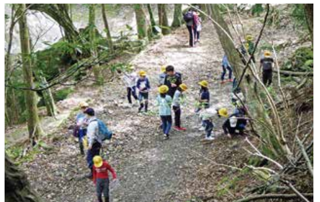
フィールドビンゴをしながら下山中の様子