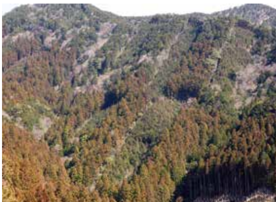
面的複層林（嶺北署：南国市）

れるよう、複層林や針広混交林への誘導など多様で健全な森林への誘導に取り組みます。