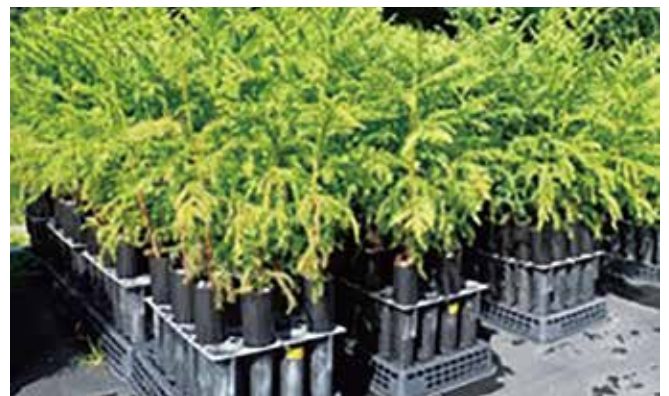
スギの大苗（コンテナ苗）