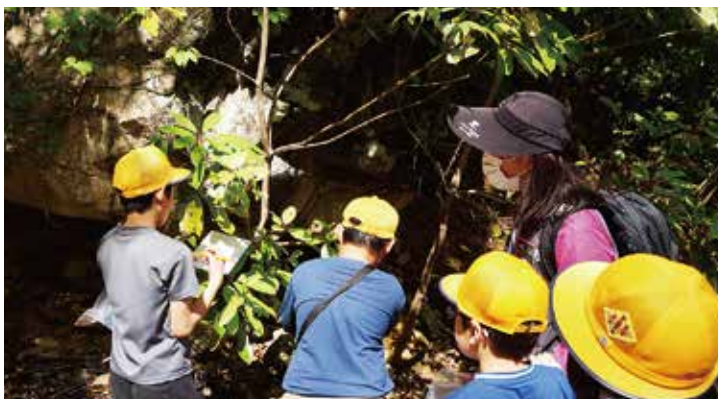
木漏れ日キャッチと樹木学習の様子