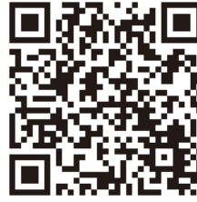
※「シラクチカズラ」の安定供給に向けた国有林の取組（徳島署）

日本三奇橋の一つとして知られている、「祖谷（いや）のかずら橋」は、多数の外国人観光客が訪問することから、「祖谷のかずら橋」の維持・保存に不可欠な架替資材の「シラクチカズラ」の安定供給に向けた国有林の取組を紹介する英語版パンフレットを作成し、公表しました。