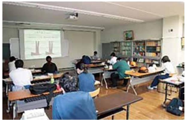
市町村林業担当者実務研修