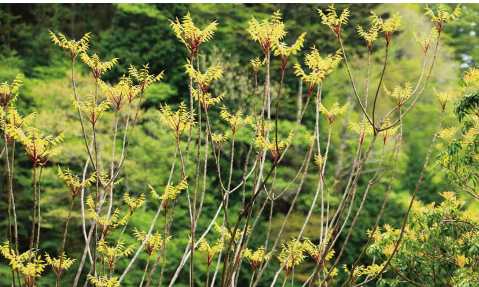
白髪・奥工石（ヤマハゼ）