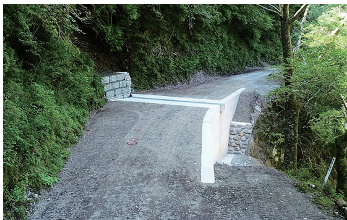
林野庁長官賞受賞工事（亀谷林道災害復旧工事）