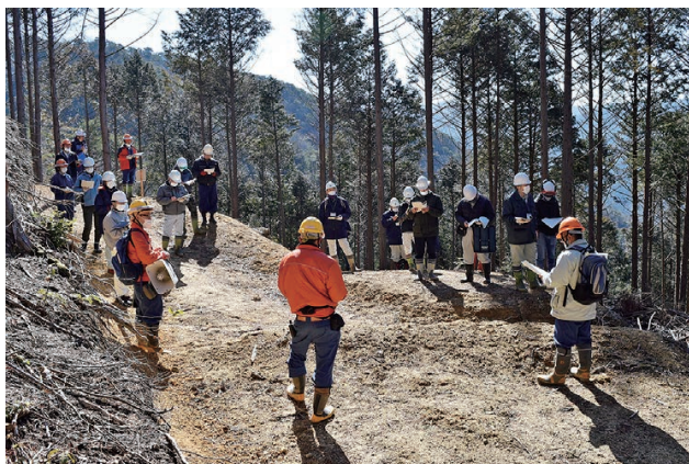
間伐後1年目箇所での林況説明

今回の現地検討会は、列状間伐の推進を図ることを目的に開催したもので、列状間伐実施後1年、4年、12年が経過した間伐箇所を実際に見ていただきました。