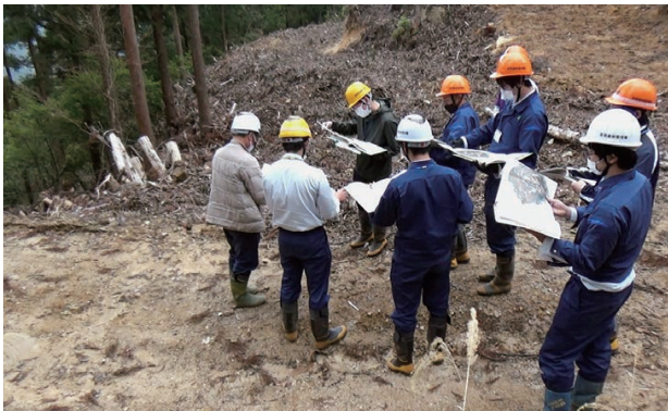
保育間伐【活字型】実施箇所の見学

保育間伐【活字型】実施箇所では、搬出間伐についての基礎、列状間伐を取り入れることになった経緯などについて、地域統括森林官（魚梁瀬・