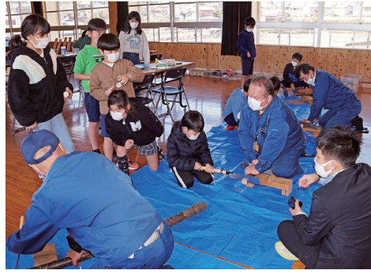
ノコギリ挽き体験の様子（上川口小）

るキットを当センターで準備しました。ヒノキの匂いや手に取って優しい手触りを感じてもらってから作り方や注意点を説明し、小箱作りを行いました。