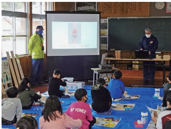
ふゆめがっしょうだんの絵本のお話の様子(大用小)

1月24日に四万十市立大用小学校の全校児童26名、1月31日に宿毛市立橋上小学校の全校児童11名、2月7日に四万十市立中村小学校の1年生41名、2月20日に、大月町立大月小学校の2年生18名、2月28日に黒潮町立上川口小学校の1〜4年生計32名、以上5校の128名を対象にした森林環境教育（森林・木工教室）を実施しました。