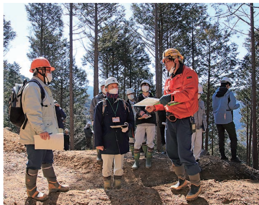
活発なご意見ありがとうございます

今回の現地検討会は、列状間伐の推進を図ることを目的に開催したもので、列状間伐実施後1年、4年、12年が経過した間伐箇所を実際に見ていただきました。