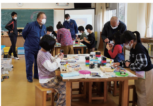
製作の様子(大月小)

材料は形も下絵も全く同じものですが、児童の自由な発想で変化が加わり世界に一つだけの作品が次々と出来上がりました。