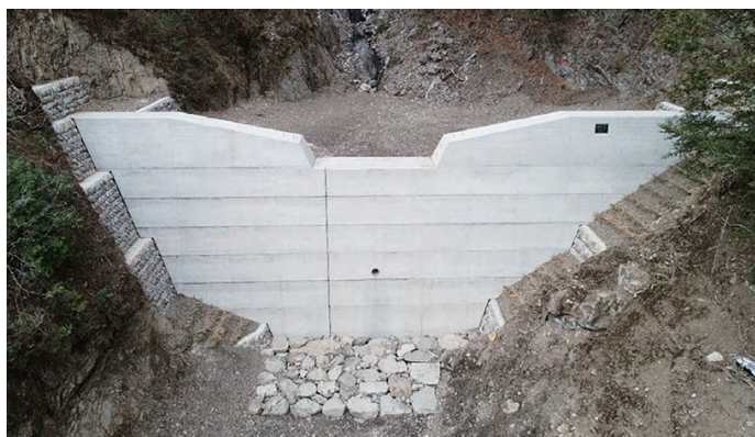
林野庁長官賞受賞工事（雁巻山（2031）復旧治山工事）

四国森林管理局では、今後とも、国民の要請にこたえる適切な森林の整備・管理を推進していく上で、工事施工者とも連携し、適切な施工管理、コスト縮減、環境への配慮、創意工夫を行い、公共事業の品質向上に努めてまいります。