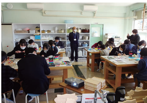
製作の様子(橋上小)

その後、樹木に関心を持つてもらうため、「庭にはいろいろな樹木があり、四季による変化や生息している虫などとそれを目的にいろいろな鳥がやって来るので、通学路や運動場から日々観察してみてください」と説明しました。