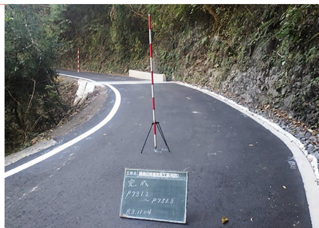
林野庁長官賞受賞工事（掃地山林道改良工事）