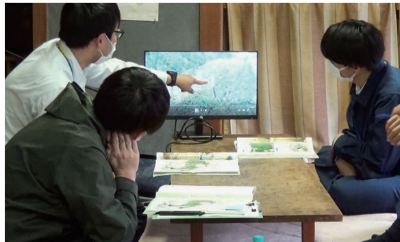
ドローン映像の説明

西川森林事務所）から説明があり、「列状間伐の伐採列幅は何メートルか」「一車両系集材と架線集材の見極めをどのように行っているか」などの質問がされました。