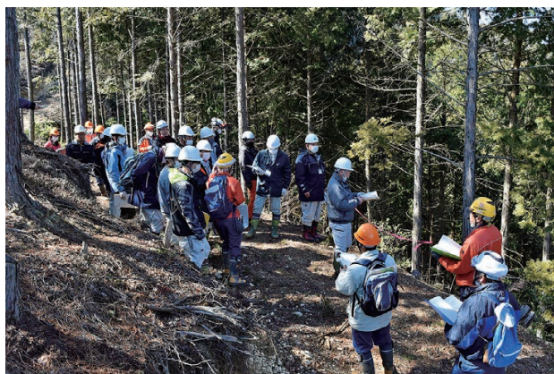
間伐後4年目の箇所での林況説明

はじめに、香川所長の挨拶があり、当所管内での列状間伐の実施状況や列状間伐のメリット等を説明しました。その後、間伐実施後1年が経過した現地に向かい、林況を確認しながら、事業概要、列状間伐をする上で生産性を向上させるための取組事例についての説明を行いました。参加者は、現地で実際に林況を見ることで、列状間伐のイメージをつかんで頂けたようので、事業の発注方法や伐採列の取り方等、様々な質問がありました。続いて、間伐実施後4年が経過した箇所に移動し、林況等の説明を行い、樹冠や下層植生が、1年目と比べて変化してきた様子を見て頂きました。最後に、資料を用いて間伐実施後12年が経過した箇所を説明し、質疑応