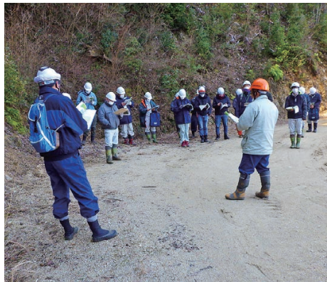
間伐実施状況の説明

2月27日、香川森林管理事務所管内の檜原国有林44林班において、現地検討会『さぬきの山』列状間伐の実施と林況』を開催しました。香川県や市町、森林組合などから約20名、四国森林管理局から資源活用課の企画官をはじめ4名、当所から7名が参加しました。