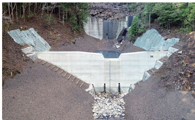
林野庁長官賞受賞工事（宝蔵山（2120）復旧治山工事）