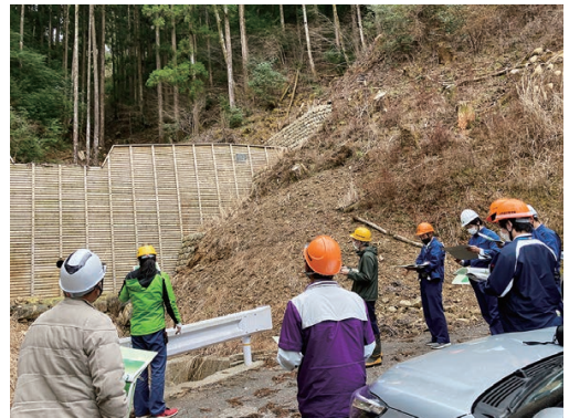
治山工事実施箇所の見学