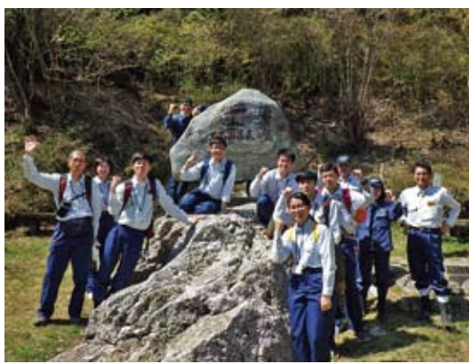
新規採用者と講師の集合写真（工石山杖塚）

座学が続いていた研修の中で、自然の空気を吸収しながら学ぶことができ、緊張もほぐれた良い機会であったと思います。 また、23日には、新規採用職員が抱えている不安や悩みなどに応えることを目的に、四国森林管理局内の先輩職員（7名）が、自らの体験に基づいたアドバイスをを行うといった