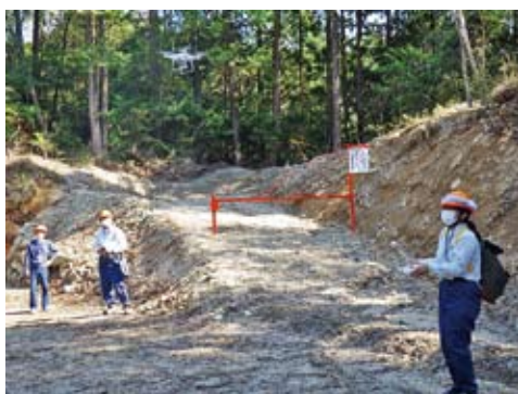
ドローンの飛行練習の様子

せることを目的に、新規採用者研修を行っております。今年度は対象となる8名の新規採用職員に、4月19日から23日まで新規採用者研修を実施しました。 研修は、局の事業概要や各課の業務内容の講義などの座学が多くを占めていますが、実際の業務では、現場作業が多いことから、21日に、「国有林地見学」として、「日本美しの森 お薦め国有林」にも選定されている、「工石山自然休養林」で現地研修を行いました。 当日は好天に恵まれ、「日本美しの森 お薦め国有林」や、自然休養林等について説明を行った後、根曲がりスギや、白鷺岩等、工石山の様々なポイントを見学しながら登山を行いました。