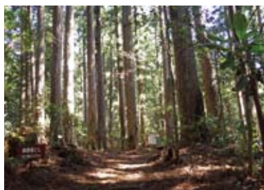
千本山風景林（高知県馬路村）