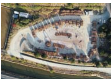
竹島土場（高知県四万十市）

その技術の民有林への普及を図るために、以下の事項に取り組めます。 ○造林の低コスト化に向け、伐採と造林の一貫作業システム、コンテナ苗の活用、下刈りの省力化、ICTの活用、集約化試験団地での実証などに取り組めます。 ○木材生産の収益性の向上を図るため、列状間伐やシステム販売の実施、民国連携した木材供給等に取り組めます。