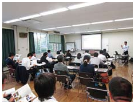
市町村林業担当者実務研修の様子

森林経営管理制度や森林環境譲与税の制度がスタートしたことにより市町村の林務行政の役割が一層高まってきていることも踏まえ、当局職員のみならず、市町村林務担当者等のスキルアップや林業事業体の育成のために、以下の事項に取り組めます。 ○現地検討会の開催など、林業事業体の育成に取り組めます。 ○森林総合監理士活動の推進・活性化に取り組めます。