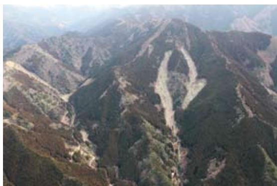
立川下名崩壊（高知県大豊町）