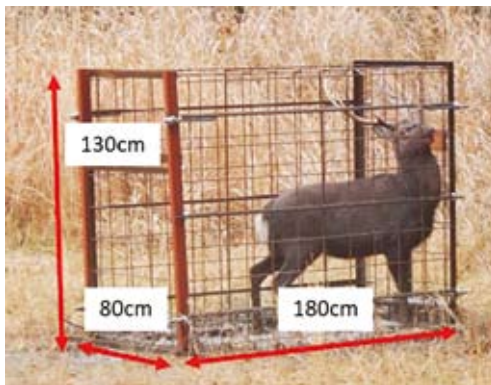
小型囲いワナ「こじゃんと1号」

として、以下の事項に取り組みます。 ○囲いワナ等によるシカ捕獲や四国森林管理局が開発した「こじゃんと1号」、「こじゃんと2号」の普及・PR、LPWAを利用したワナ見回りの実証など、シカ被害対策を推進します。 ○防護柵及び忌避剤を用いた試験の実施など、ノウサギ被害対策を推進します。