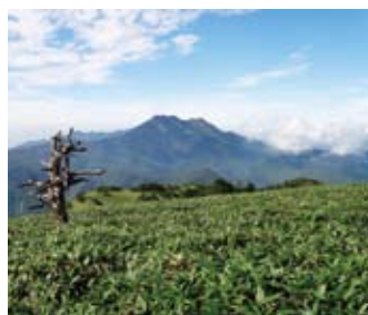
石鎚風景林（愛媛県西条市）

○多様な森林づくり「見える化プロジェクト」として、育成複層林施業及び針広混交林への誘導など多様な森林づくりに取り組みます。