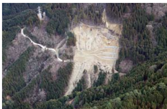
根津木崩壊（徳島県三好市）

○「防災・減災、国土強靱化のための5か年加速化対策」として、災害時に備え、迂回路としても活用可能な特に重要な林道の整備・強化等を推進します。