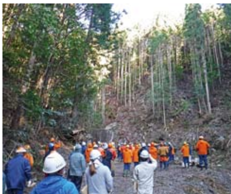
現地検討会の様子