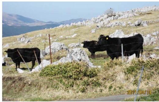
四国カルスト・五段高原

高知市から高知自動車道で須崎市へ、須崎中央ICで降りて、国道一九七号線で津野町方面へ、津野町高野で、公団基幹林道東津野城川線には入り北上し、国民宿舎天狗荘から姫鶴平へ向かい、姫鶴荘手前で右折して突き当たりの遊歩道入口(公衆トイレ)に至ります。所要時間は、約二時間三〇分です。