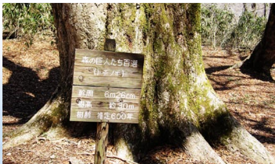
猪伏の大トチ(幹廻り)

そこから、遊歩道には入り、ツガ、モミ、サワグルミ、センノキ、サルスベリ等の木々が迎えてくれ、遊歩道の中頃に「白亜の湧き水」と呼ばれる水のみ場もあります。