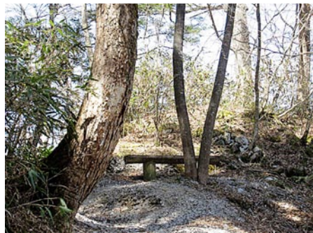
林内の遊歩道(ベンチ有り)

そこから、遊歩道には入り、ツガ、モミ、サワグルミ、センノキ、サルスベリ等の木々が迎えてくれ、遊歩道の中頃に「白亜の湧き水」と呼ばれる水のみ場もあります。