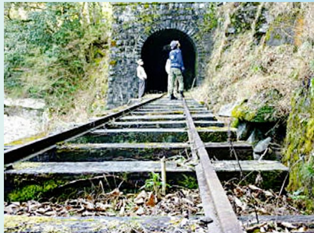
五味隧道 (馬路村馬路)