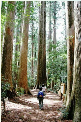
千本山 (馬路村魚梁瀬)

今回、馬路村魚梁瀬の千本山国有林を山の案内人と散策、昭和38年に廃線となりました魚梁瀬森林鉄道は今年が開通からちょうど100周年にあたり、この遺産を森林鉄道ガイドの案内で訪ねるバスツアーを実施します。