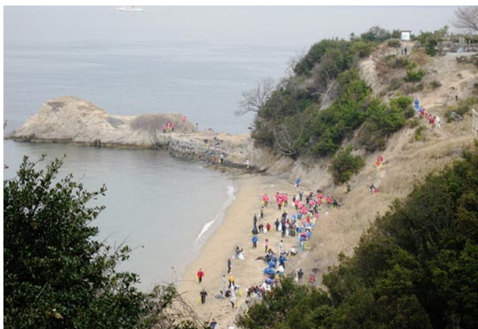
長崎の鼻（国有林）及び同海岸付近での清掃活動の様子