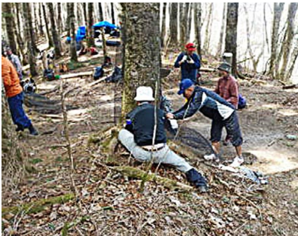
NPOによる単木ネット設置作業

登った通称「ダケモミの丘」付近で、ウラジロモミの純林が分布していることが知られていますが、生息数が急増しているニホンジカに繰り返し被害を受けているため、当署では、一昨年から保護ネットの設置を行っています。