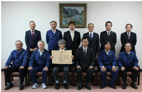
※局長ほか局幹部の皆様と現・元技セン職員(H22年から継続している取組のため、当日参加できなかった多くの方を含む職員の長年の取組が表彰につながりました。)

◆センター職員一同、思わぬ表彰に驚くとともに、これまでの努力が報われたことで、「今後の業務にも張り合いが出る」と喜んで