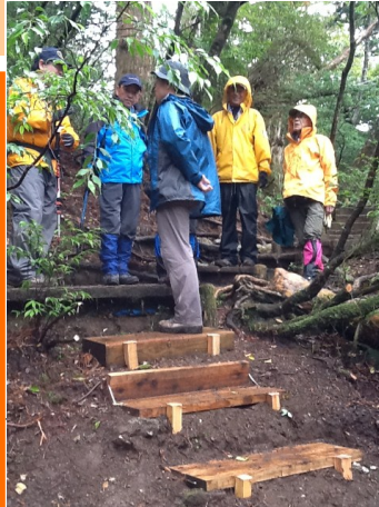
4 月 17 日縄文杉登山道での検討

活力度は、標高が高いほど、樹高が高いほど、胸高直径が太いほど、高くなる傾向が見られるが、前回から今回にかけての活力度の変化を見ると、標高や樹高や胸高直径との関係より、シロアリ穿入痕の有無と活力との関連性が見られた。