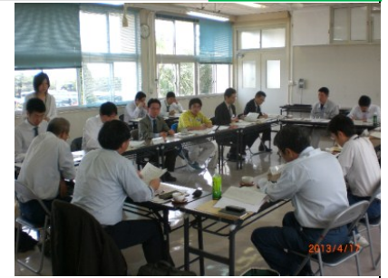
4 月 18 日 熊毛支庁屋久島事務所での会議

平成 25 年度 関係機関による 世界遺産地域連絡会議幹事会を開催 — 縄文杉の暫定迂回路について現地検討会を実施 —