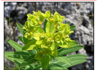
イワタイゲキ (トウダイグサ科)

関東以西に分布する多年草。海岸の岩場に生え、高さ 40 ～ 60 センチほどで、群生して株立ち状になる。茎は太くて葉は接近してびっしりと互生する。茎の先の葉腋から放射状に枝を出し枝先に杯状花序をつける。 花期 4 ～ 6 月