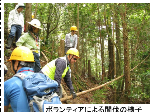
ボランティアによる間伐の様子

「自分が強くなれた気がした」といった声を聞いたとき、笑顔の中、無事終了した。屋久島では、全島的な環境教育の計画を進めており、環境教育ネットワークの活用も進んでいます。ボランティアによる間伐の様子