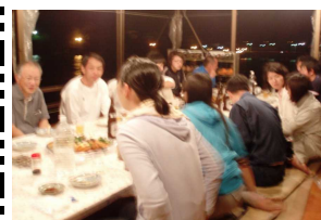
学生との交流の様子

愛媛大学森林資源学専攻の大学生が、屋久島でフィールドワークを行う。この活動は、屋久島での自然体験を通じて、環境保全の意識を高め、地域との交流を図ることを目的としている。