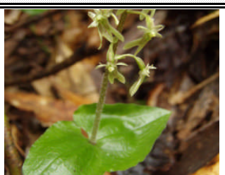
ヒメフタバラン (らん科)

めた色数茎で草の 花手唇かのの、。林本 期と弁ら花途無茎内州 三なる形紫が中柄はにから 五月。種色に對ハさえ琉 をでな生ト〇小ま 見先のつ形くさの け二花きの二な る裂は、葉〇多低 決し緑少がcm年地