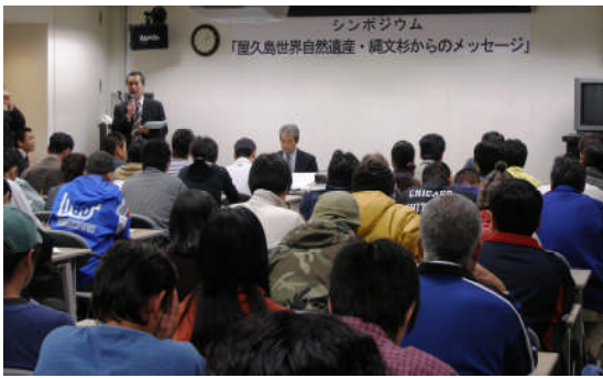
シンポジウムの開会と満員の会場

に樹つこ復文 て環ら島も境屋保主理 、木いと措杉シ開境の世と文久護催局 二 屋医てを置ン催メ文界、化島官し、屋 月 久が屋機一樹ジま村セ然セン、務環久八日 島報久に〇勢ウしセー遺ポン(所、境島島日 界告島そ年回ムた。タ・ウー)鹿屋林九州森、九 自然するのの目復で。を縄の屋久管州理森林 遺産と田況迎植、に屋文共久島島理森林 のも一にた回縄 い島か久の環、然が管