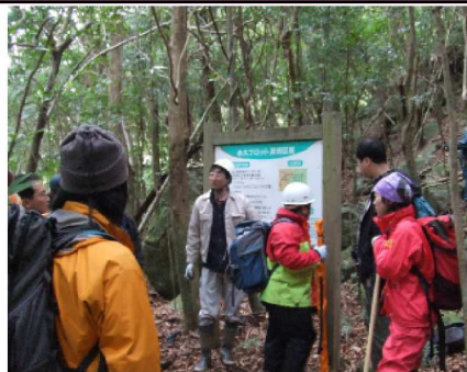
永久プロット看板の前で