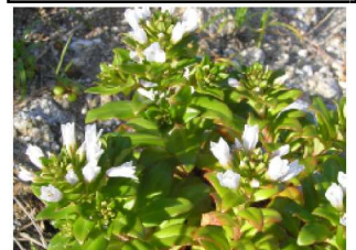
ハマボツス (さくらそう科)