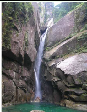
竜王の滝 (宮之浦川上流)

る一のの 。花葉を 。一、多 。五、く 。深、つ 。五、け 。裂、る 。は、深 。四、く 。七、る