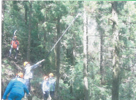
環境学級(林業体験)

草本層では、カツモイデ・ヒロハノキ・リシダ・ホウビシダ・ヘツカシダ・リュウビシダ・ツルホコケ・スホシクリハラシなど、シダ植物が多い。シマイセンリウ・ヤクシマシサイリミノキ・フウトウカヅラ・ヒメアリドウシも個体数が多く植被率が高い。