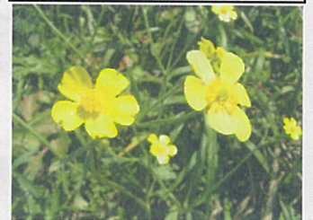
ウマノアシガタ (きんぼうげ科)