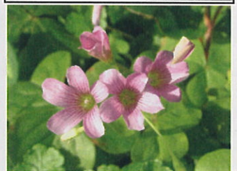
ムラサキカタミ (かたばみ科)