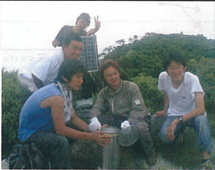
雨量計の回収(黒味岳)

八月五日、鹿嶋大学に5名の学生が就業体験学習に訪れた。この日は、鹿嶋大学の学生5名が就業体験学習のために屋久島を訪れた。この日は、鹿嶋大学の学生5名が就業体験学習のために屋久島を訪れた。