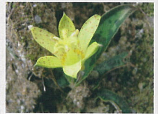
チャボホトトギス (ゆり科)

チャボホトトギスは、屋久島の固有種である。花は黄色く、葉は狭く長い。この植物は、屋久島の自然環境を代表している。