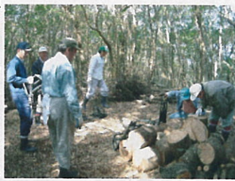
(人力による担ぎ出し)

島在住の者が、自然の恵みを受けて育ち、島人の生活を支えている。この中には、現在絶滅の恐れがある種も数種見られる。この中には、現在絶滅の恐れがある種も数種見られる。この中には、現在絶滅の恐れがある種も数種見られる。