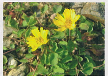
イワガナ (ナガキ科)