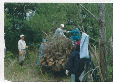
(軽トラックによる林外搬出)

て開民まきイ屋町田町取そ 、発のました続ド久に集は組そ 「総参た、検、取、取、取、取、 屋合加、の三、七、七、七、七、 久セ下、三月、七日、七日、七日、 島におけるに、島、島、島、島、 の離一般、島、島、島、島、 の住