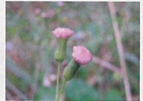
ウスベニガナ (きく科)

久島では、ほぼ一年中(屋 れ球つなくるに四本 花ののける、。か○本 期は、形、花、葉、。州 では、の、。花、は、ほ、以 、ほ、を、。花、は、ほ、南 ぼ、待、。花、は、ほ、に 一、つ、。花、は、ほ、分 年、つ、。花、は、ほ、布 中、て、。花、は、ほ、し、 、。花、は、ほ、高 、。花、は、ほ、さ 、。花、は、ほ、さ