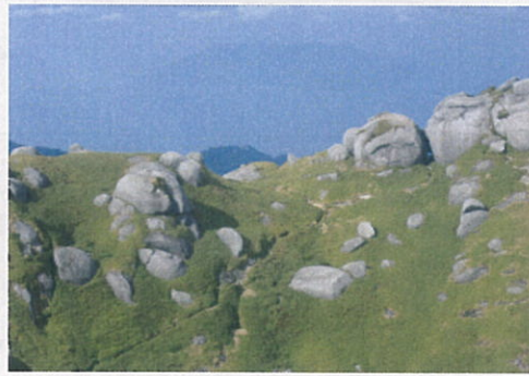
(永田岳登山道南東側斜面)

い皆工了等へた定全月 方て様事しのりと事体及こ 、おの現ま本でこ業計びの 木礼ご場し年のろに画一件 製を理にた度資でつ並二に 歩申解お。の材すいび月つ 道しとけこ予運がてに号い 等上ごるの定搬、お本をて 木げ協登間事と一知年もは 製ま力山、業木二ら度つ、 構すに者現を柵月せで一 造。つの地完工、し予、一