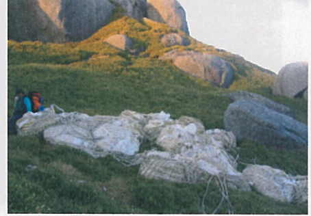
(資材の保管状況(頂上付近))

協山保トの鞍るる存 力管ン支部事と業と山 をのし袋障と業と道 を皆て、と頂でよに おさあモな上す。り登 願んりツら部。り登 いのまコな。搬植山 しごす等い登入生者 ま理の分二山資をを と、割所利は復導 ご登しに用、す