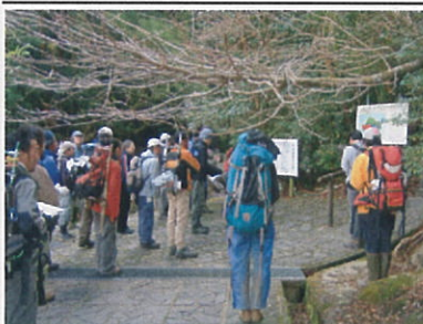
(清掃実施前の打ち合わせ) ガイドの皆さん有難うございました。

て動まがはの 施内○町ド いが改捨ゴ特にの名が環昨 ま行、めてミにしまボが、連年 す。れ後強い前谷た。ラが、絡一 。るもくーに小。テ。加協二 ここのりい一周。ティ。し、議月 とのりい一周。ア。白野、会二 をよまう山辺。清。谷、林、屋 期うし気にの。掃。雲、上、久 待なた持ゴ大。を。水、上、島 し活。ちミ。量。実。約、屋、ガ 峡久イ