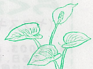
クワズイモ科 さといも

四国と九州に分布する常緑多年草。屋久島の林内にはどこでも普通に見られ、大群落をなしている。大きなものは2m近くになる。花は包葉の筒状の部分に雌花が収まり、その上に雄花の集まりがつく。五、六月に白い花を咲かせる。