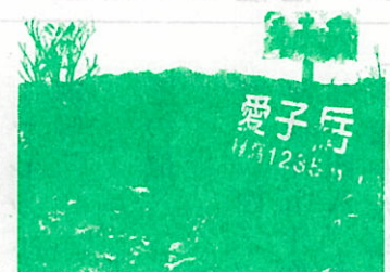
(愛子岳から奥岳を望む)