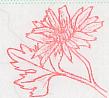
サツマノギク きく科

熊本・鹿児島両県の東シナ海側と甌島・屋久島の海岸部で見られる常緑多年草。高さは五十cm程度、花は園芸品種とも思えるような美しさで、葉の裏には毛が密生しているため銀白色で表側から見ても葉の周囲が白く縁取られているのがわかる。