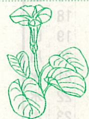
グンバイヒルガオ ひるがお科

四国以南の海岸の砂地に生える多年生のつる植物。葉は、広楕円形で、先端が大きくくぼみ相撲の軍配になっている。花は、直径五センチメートルほどで、ひるがおに似た紅紫色。午後にはしぼんでしまう。 花期は七〜八月