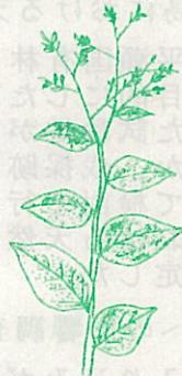
シマクラガンピ (じんちょうけ科)

大分県以南の東側一帯と甌島及び屋久島だけに分布する高さ二m前後の落葉低木。屋久島では標高五〇〇m辺りから、陽当たりのよい林道脇や尾根筋で見かける。八、九月にかけて小枝の先が枝分かれして、黄色の小花を十数個ずつ咲かせる。