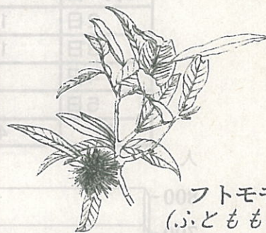
フトモモ (ふともも科)

屋久島を分布の北限とするインド原産の帰化植物で、高さ十m程になる常緑高木。葉は対生し、花は四cm程で雄しべが多く、花弁より長い。花期は五～六月で、屋久島ではホトとよばれ、川筋を探せば白く美しい花がみられる。果実はうすく黄みを帯びた白色。熟すると甘く美味しい。