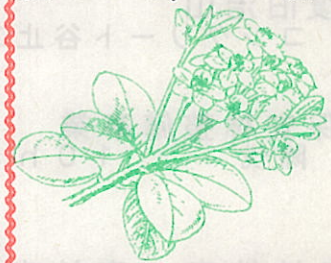
シャリンバイ (ばら科)

山口での指導に各交通機関が参加することとなりました。屋久島森林管理署では、荒川林道終点・楠川三叉路については、木材搬出施設であり、正規の登山道ではないので、問題の早期解決に向けて屋久町と引き続き協議していることを説明し、理解と協力を要請しました。