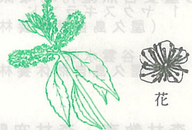
クロバイ (はいのき科)

千葉県以南に分布する常緑高木。大きなものは高さ一〇m、幹は直径三〇cm以上にも達する。樹皮が黒いのでクロバイという。花期は4〜5月、通称県道安房公園線をはじめ屋久島のいたる所で多数の小花をつけて樹皮を覆い、山裾一面を真っ白く飾っている。